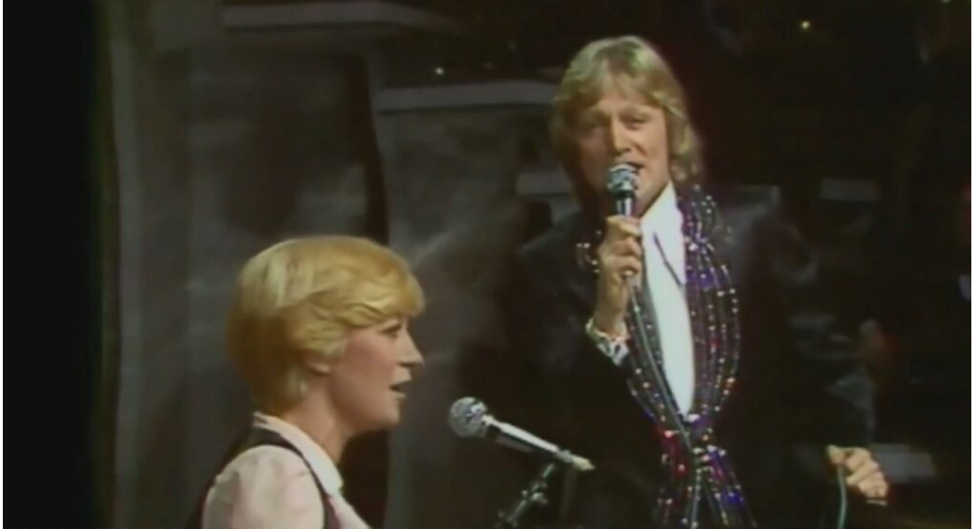
Alice Dona en duo avec Claude François.

Belleville »), Claude François (« C'est de l'eau, c'est du vent ») seront ses interprètes.