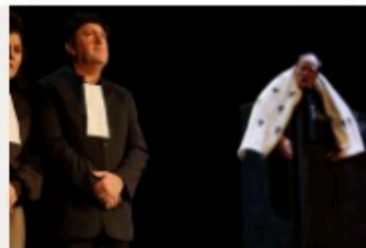
La Lionne, Gisèle Halimi