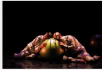
Le K Outchou