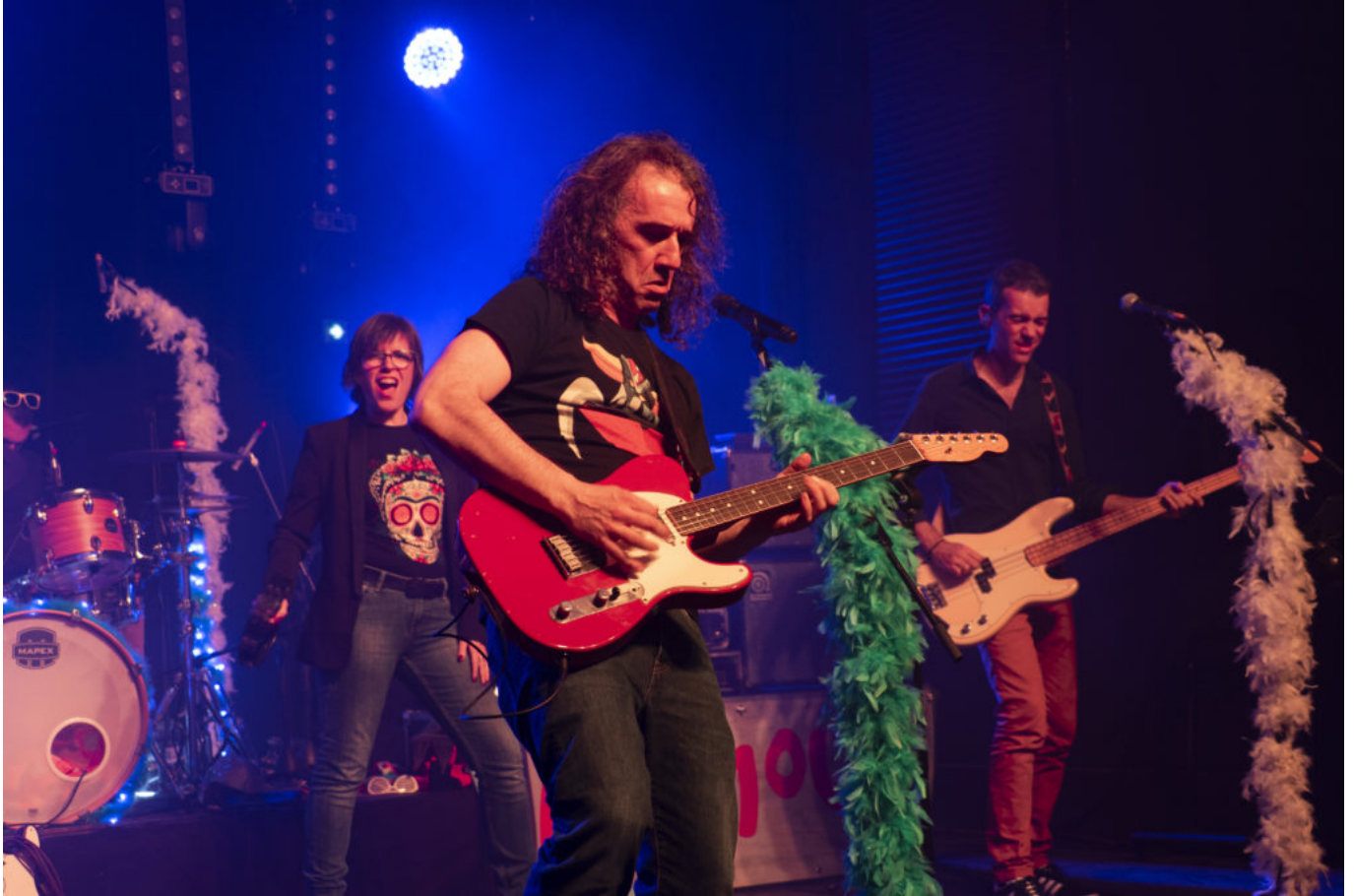
Le groupe 'Namas Pamous'.