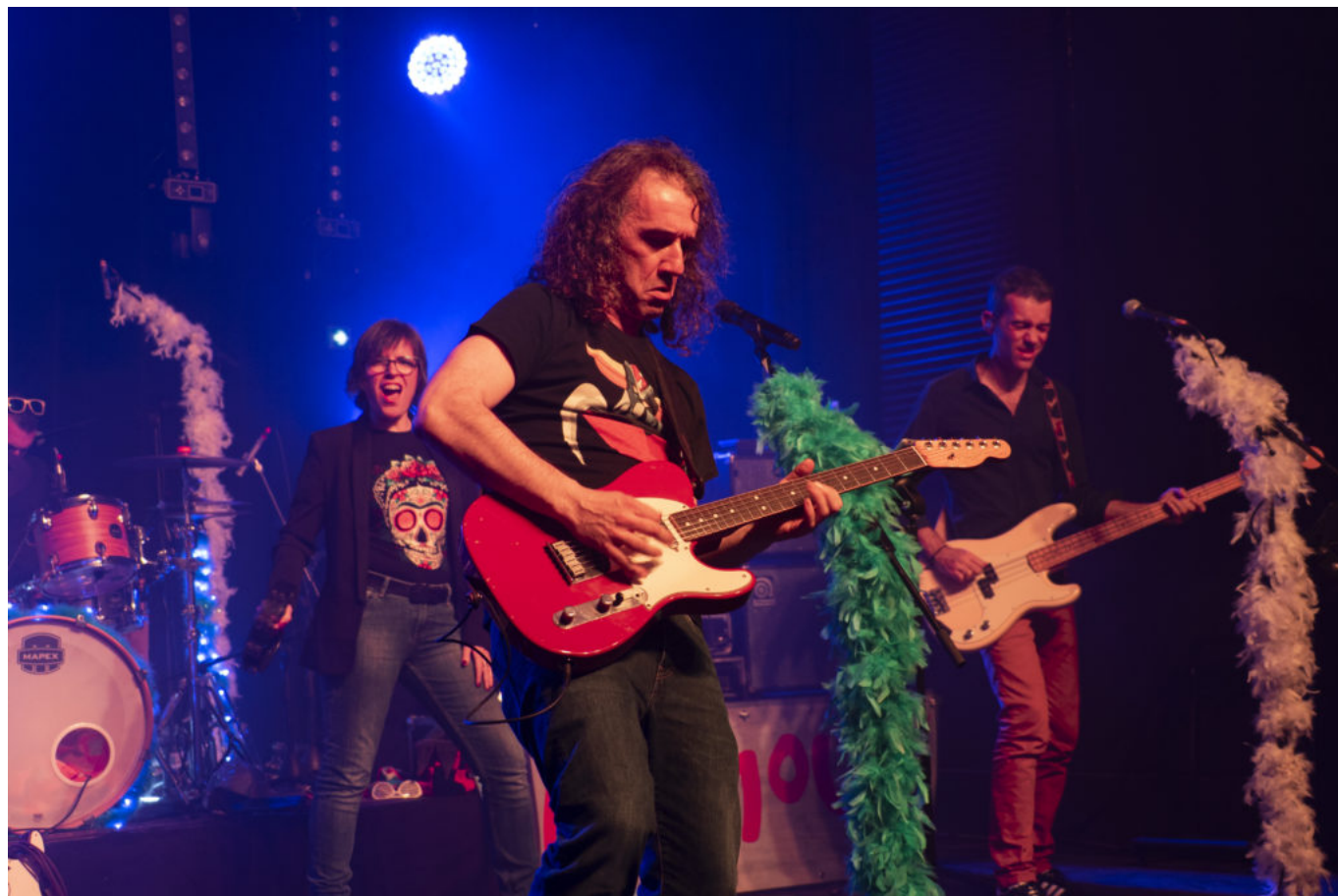
Le groupe 'Namas Pamous'.