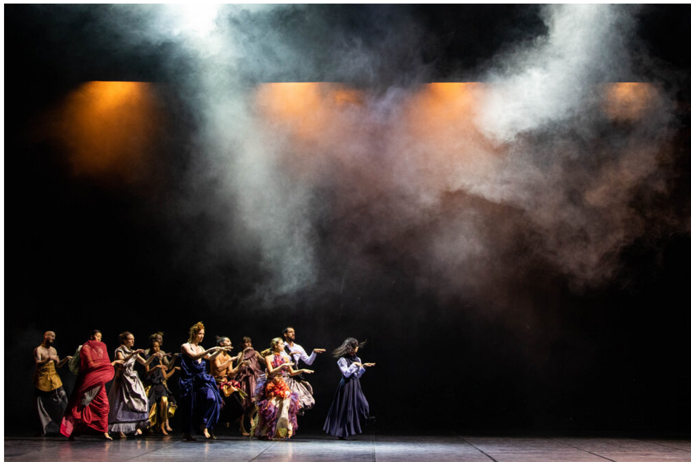
EGD Lovetrain2020