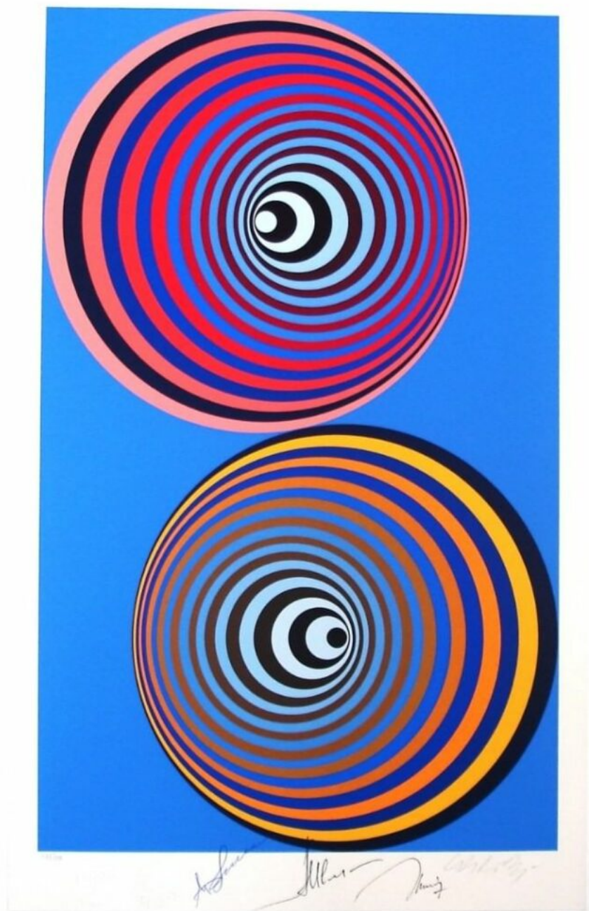
Victor Vasarely, Oerveng Cosmos, 1982, 46,é x 28,4 cm, édition 120/500, Fondation Vasarely, Aix-en-Provence © ADAGP, Paris, 2022

bâtiment, qui de son vivant pouvaient servir d'inspiration pour les commandes qu'on lui passait. Classée aux Monuments historiques depuis 2013, la Fondation, qui bénéficie de l'appellation musée de France, accueille chaque année plus de 100 000 visiteurs.