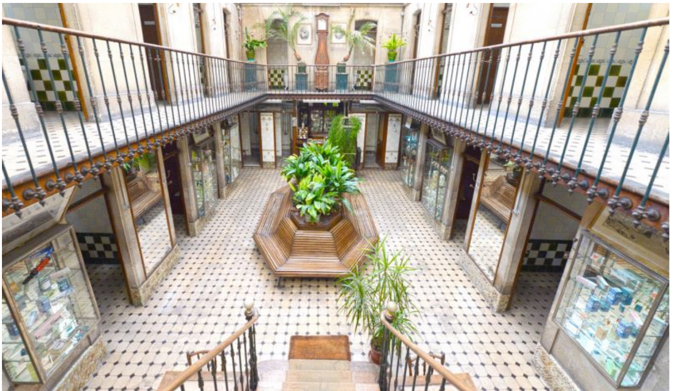
Bain Pommer, la belle époque.

Il faudra attendre l'été 2024 pour (re)découvrir, en plein cœur de l'intra-muros, les anciens Bains publics de la ville d'Avignon, dits bains Pommer , lieu exceptionnel de notre patrimoine historique. Grâce à une rénovation d'importance, c'est un nouvel écrin muséal qui ouvrira ses portes à Avignon : un patrimoine renforçant le rayonnement culturel et touristique d'Avignon.