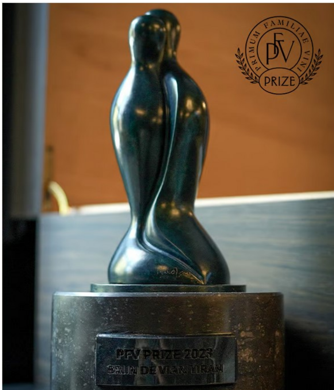
Le prix La plus belle entreprise familiale du monde

gestes ancestraux se complètent et s'enrichissent pour que le produit soit noble et beau. Bien que certaines étapes de fabrication aient été mécanisées au fil du temps, l'Homme et son savoir-faire restent les éléments clés de la manufacture. Les machines les plus modernes de l'industrie textile viennent simplement le seconder dans sa quête de perfection.