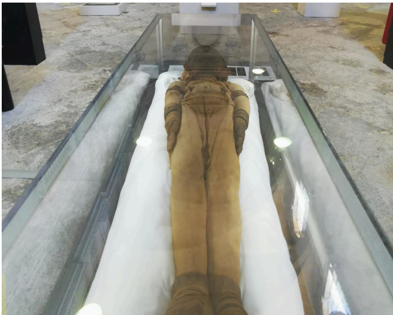
La momie majestueuse repose au cœur des lieux.

L'exposition comporte des bas-reliefs, des statues, des bibelots antiques, des fresques, des ornements... Au musée Calvet, « Au pays de la musicienne d'Amon-Rê » fait se côtoyer amulettes, momies animales et d'imposants et colorés sarcophages.