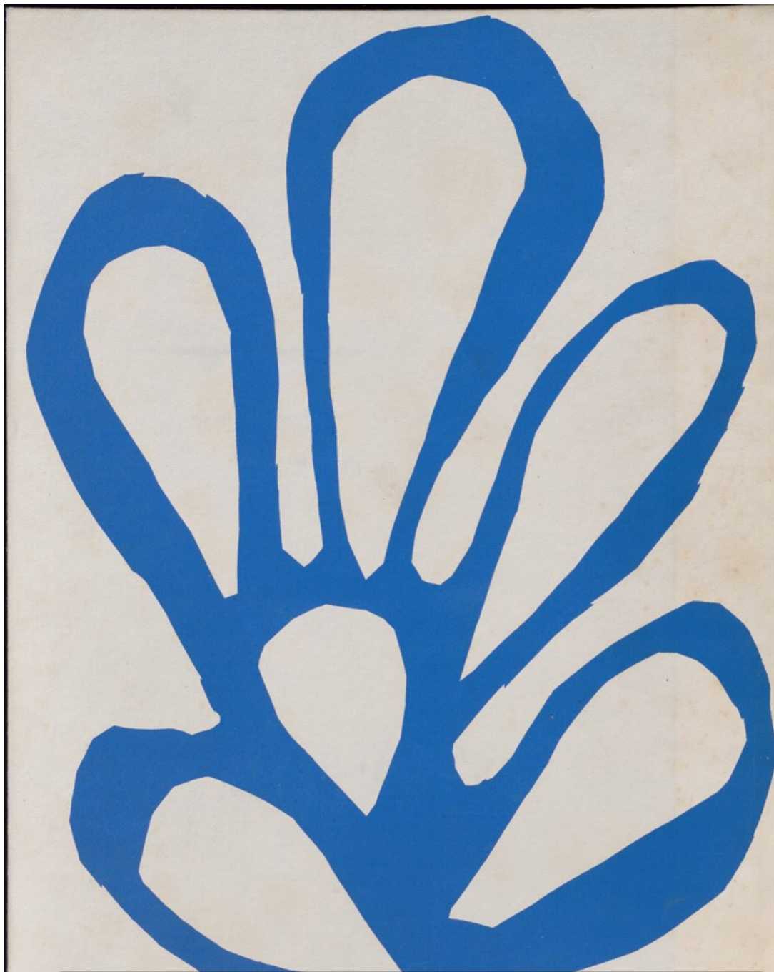
Apollinaire copyright succession Matisse