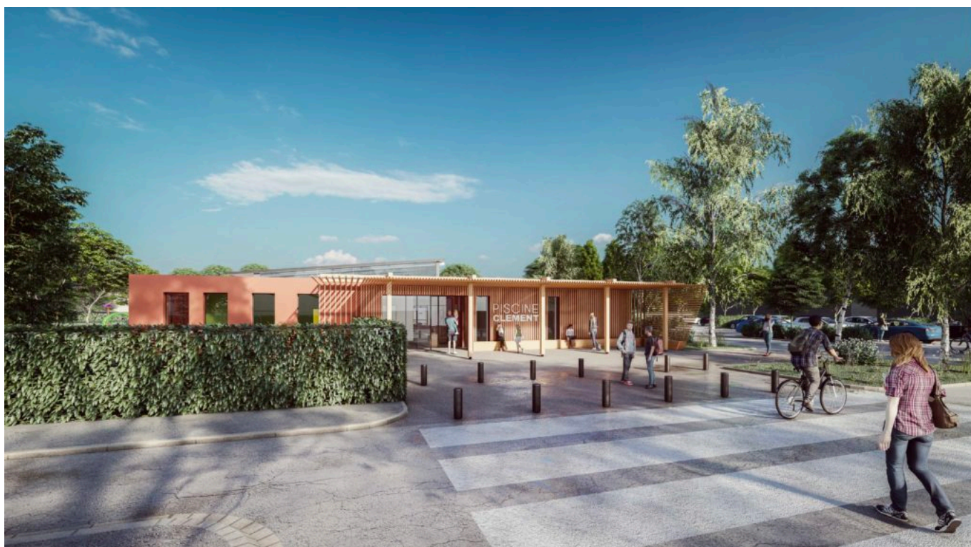
Futur extérieur de la piscine Jean Clément

«La plupart du temps vous voyez ces piscines, comme ça a été le cas pour le stade nautique, fermées, oubliées, laissées à l'abandon alors qu'elles sont des enjeux du territoire, reprend le maire. Et puis avec les températures auxquelles nous sommes confrontés en saison estivale, qui ne rêve pas de fréquenter ces lieux où l'on peut se rafraîchir et se reposer en famille, grands-parents, parents, enfants, petits-enfants, ensemble, parfois même en profitant d'un extérieur. C'est ce à quoi j'ai assisté, cet été, en me rendant au stade nautique où l'ambiance était paisible.» Justement c'est le point noir des piscines où les ados turbulents sont montrés du doigt, évinçant la tranquillité des familles et des plus petits ? « Pas quand on a met en place des animations et cela a fait tout la différence,» souligne le premier magistrat de la ville. En termes de chiffre de fréquentation ? Le stade nautique devrait accueillir, dans une année normale, 200 000 personnes. Les autres piscines ? Peut-être tout autant...» considère l'édile.