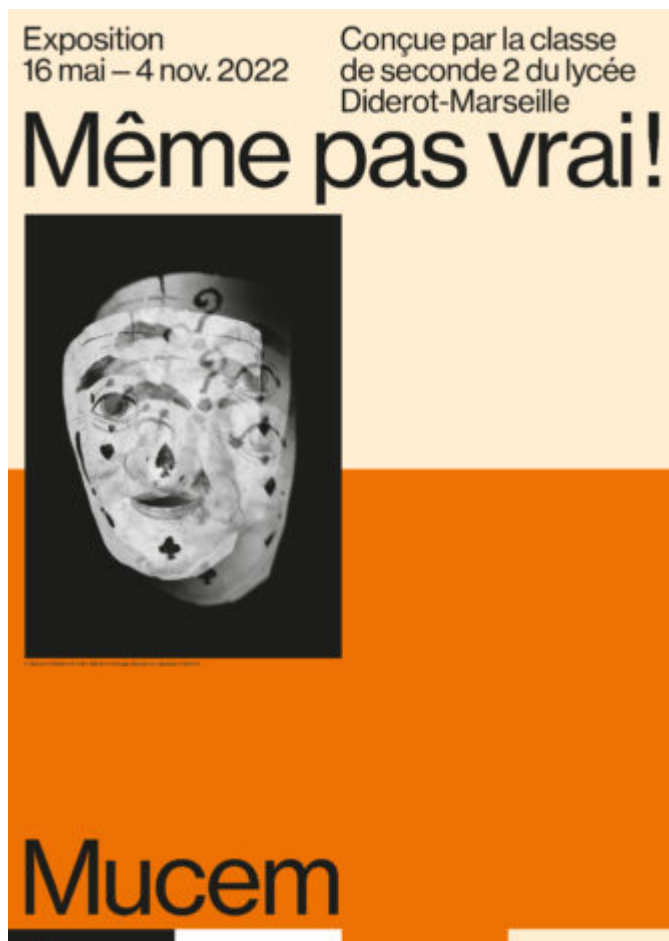
Affiche 'Même pas vrai !'

Musée des civilisations de l'Europe et de la Méditerranée , 7 promenade Robert Laffont (esplanade du J4), Marseille - Musée ouvert tous les jours de 10h à 20h - Billetterie à retrouver ici - Toutes les activités proposées sont accessibles sans réservation et sans tarification supplémentaire, hors 'Pharaons super-héros' (8€).