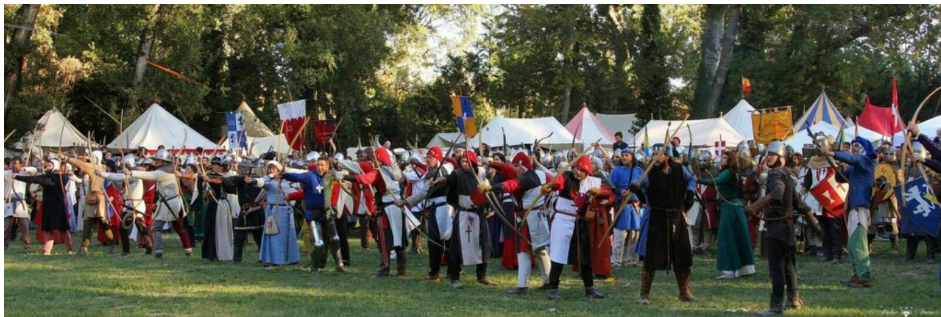
Festival médiévale de la Rose d'Or édition 2021

Le prix d'entrée est de 5 € pour les visiteurs de plus de 12 ans. Sur place, toutes les activités seront gratuites et une taverne médiévale fournira, à un prix modique, boissons et repas.