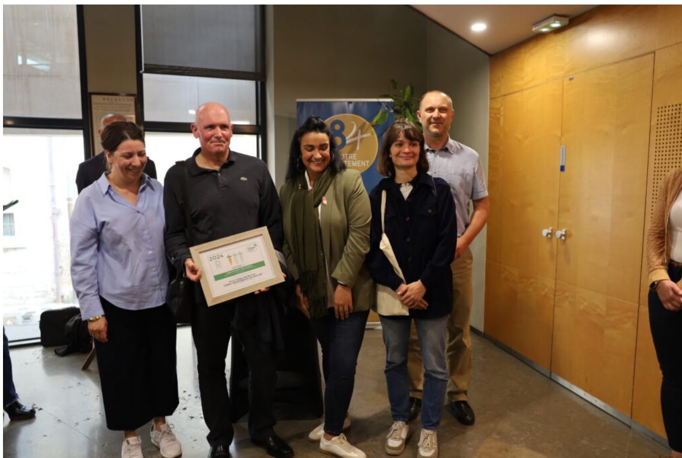
Collège Jean Bouin, Isle-sur-Sorgue