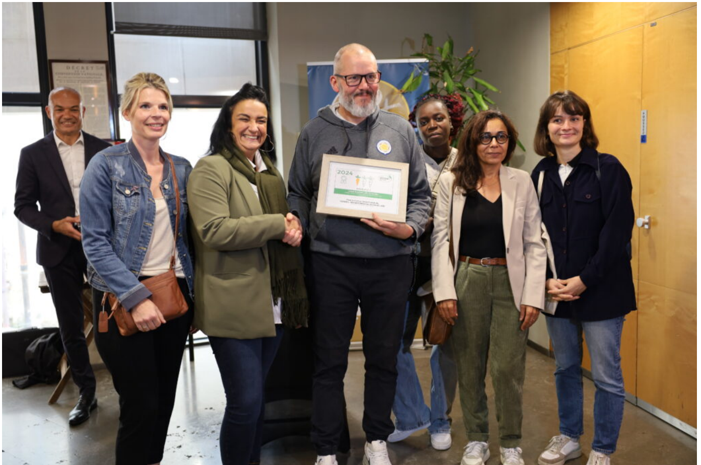
Collège Anne Franck, Morières-lès-Avignon