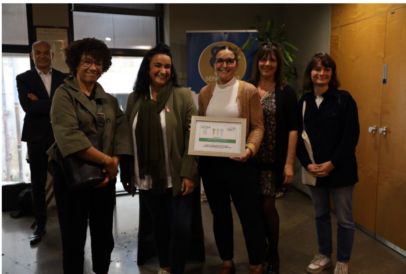
Collège Pays de Sault, Sault

Cliquez sur les images ci-dessous pour les agrandir