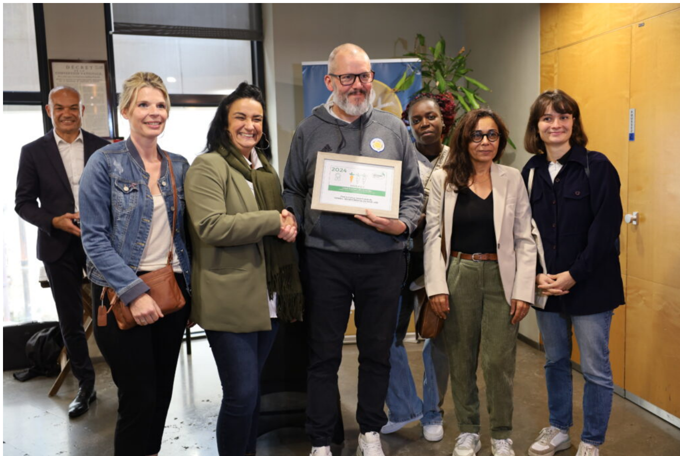
Collège Anne Franck, Morières-lès-Avignon