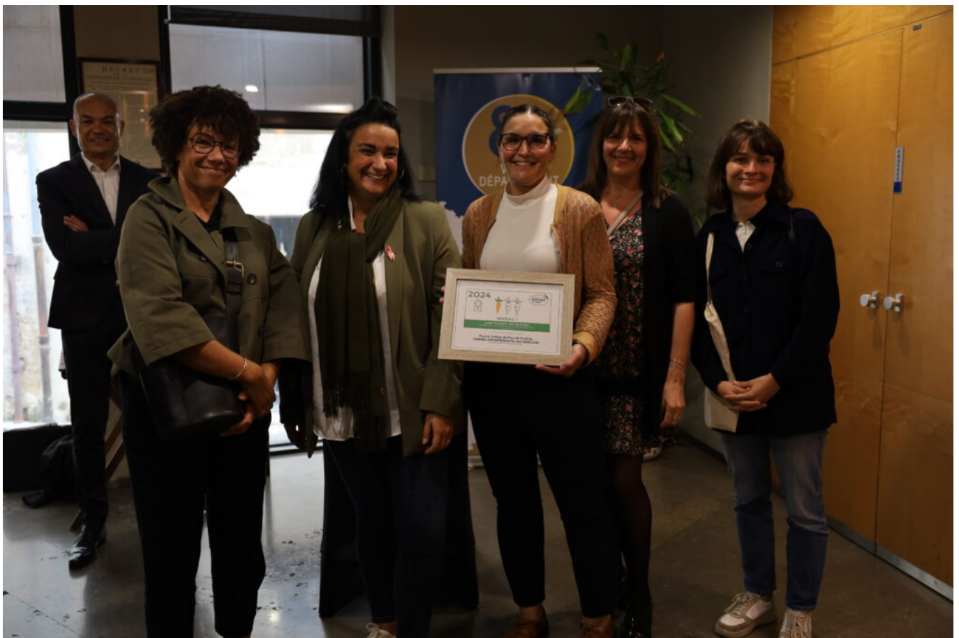
Collège Pays de Sault, Sault

Cliquez sur les images ci-dessous pour les agrandir