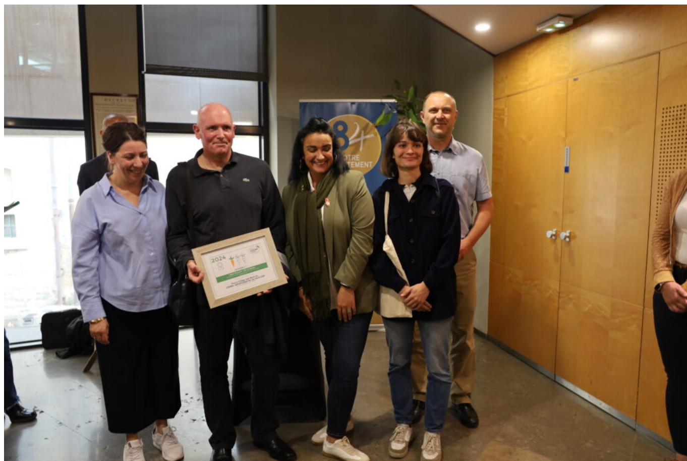
Collège Jean Bouin, Isle-sur-Sorgue