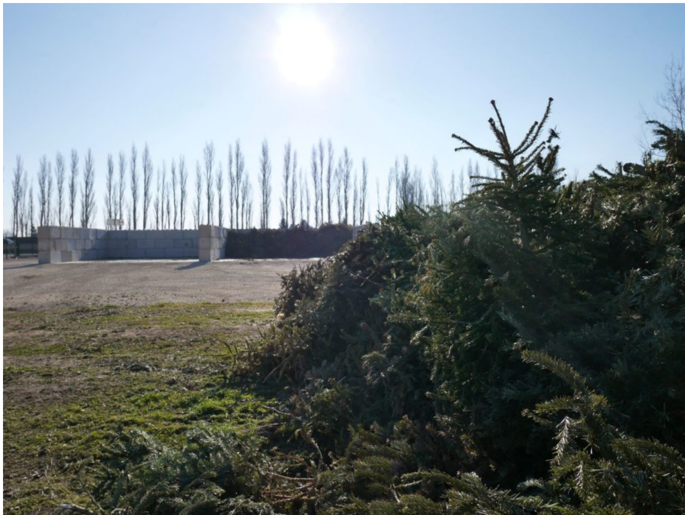
Plateforme de déchets verts à Althen-des-Paluds