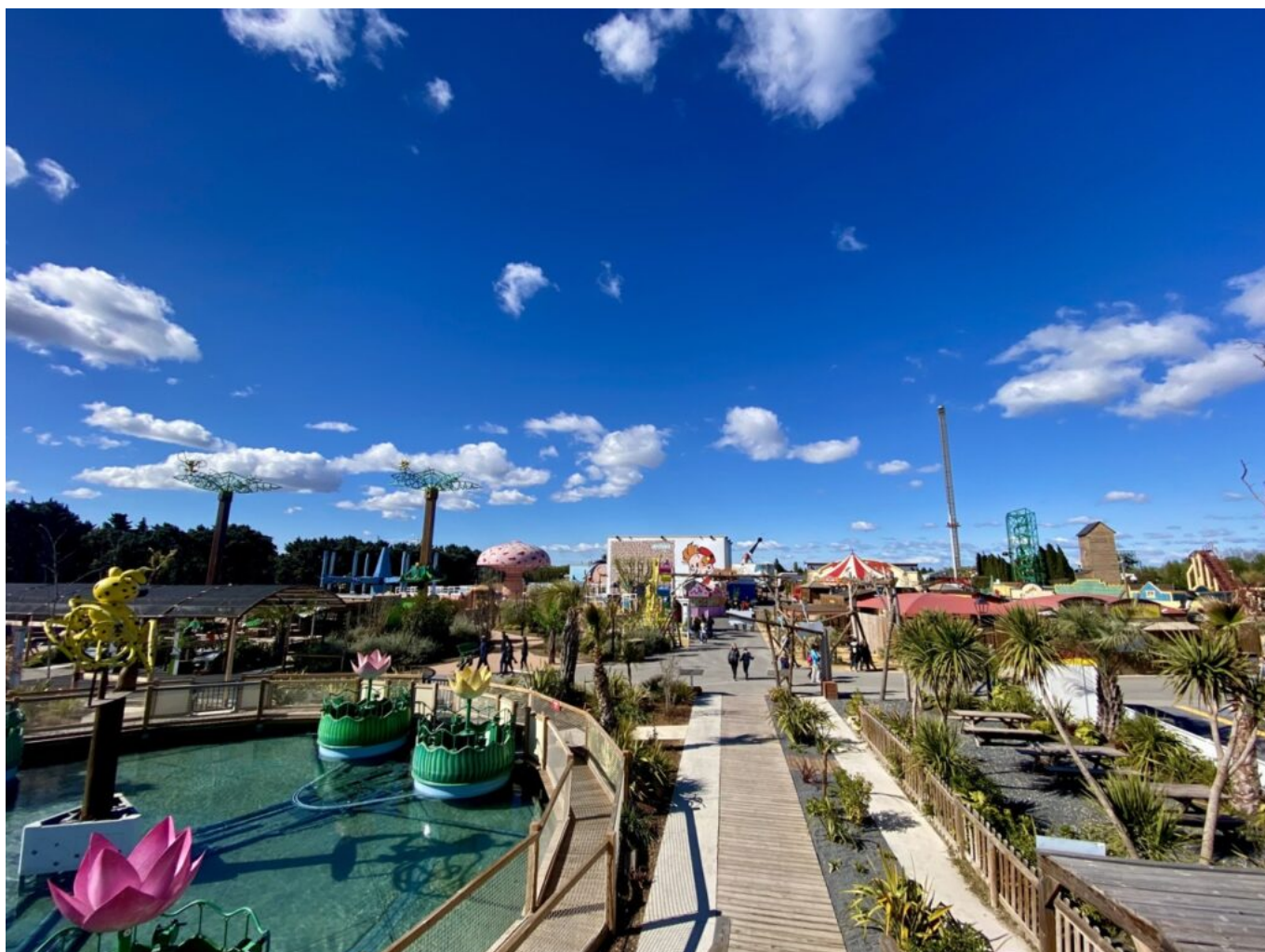
Vue d'ensemble du parc depuis la jungle tropicale des marsupilamis.