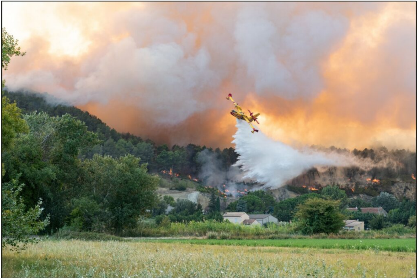
Intervention d'un Canadair sur la Montagnette à Barbentane, Copyright Jeff Le Cardiet