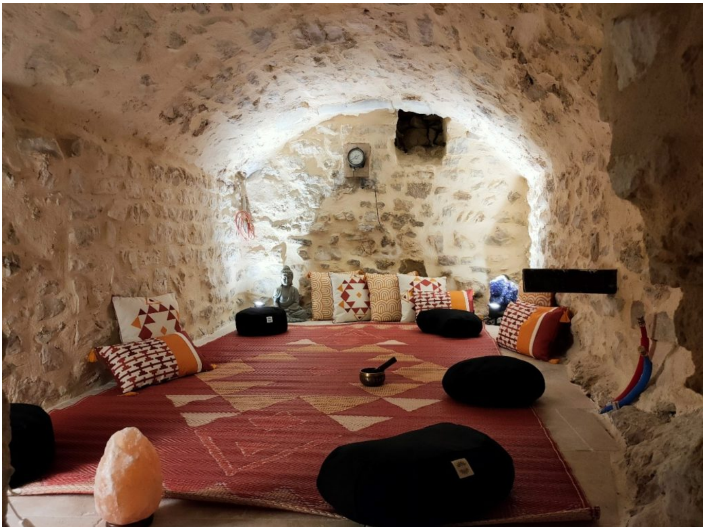
Espace bien-être, véritable havre de paix.

professionnels... Michel a pensé à tout. « En accord avec la philosophie du label La Provence à Vélo , nous mettons à disposition de notre clientèle du matériel et tous les équipements nécessaires. Ils peuvent recharger leur vélo électrique (VTT ou vélo de route). » Les convives pourront même disposer d'un espace de cryothérapie jusqu'alors inexistant à Sault. Un équipement qui permettra de soulager les tendons et soigner les douleurs musculaires. Concernant la distinction de l'hôtel gîte : « il manquait un positionnement 3 étoiles dans la région, c'était pour moi logique d'occuper ce positionnement là. Je préfère être un bon 3 étoiles qu'un mauvais 4 étoiles. »