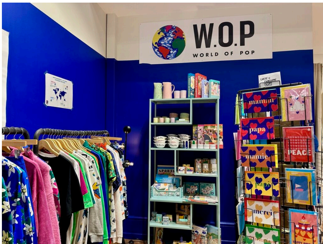
Un coin du pop-up store avignonnais.