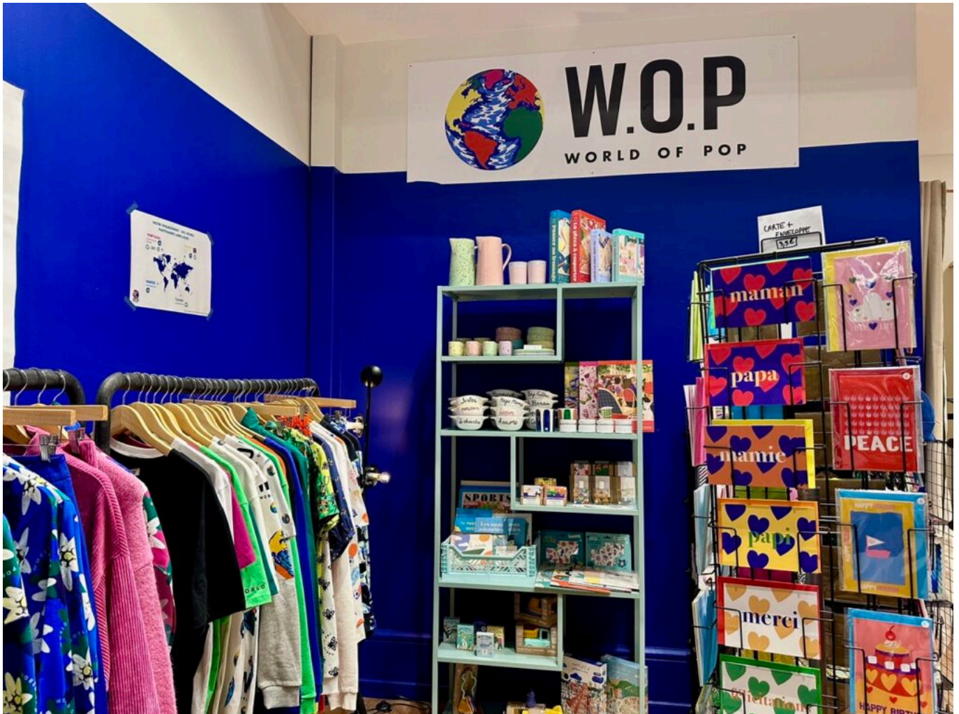
Un coin du pop-up store avignonnais.