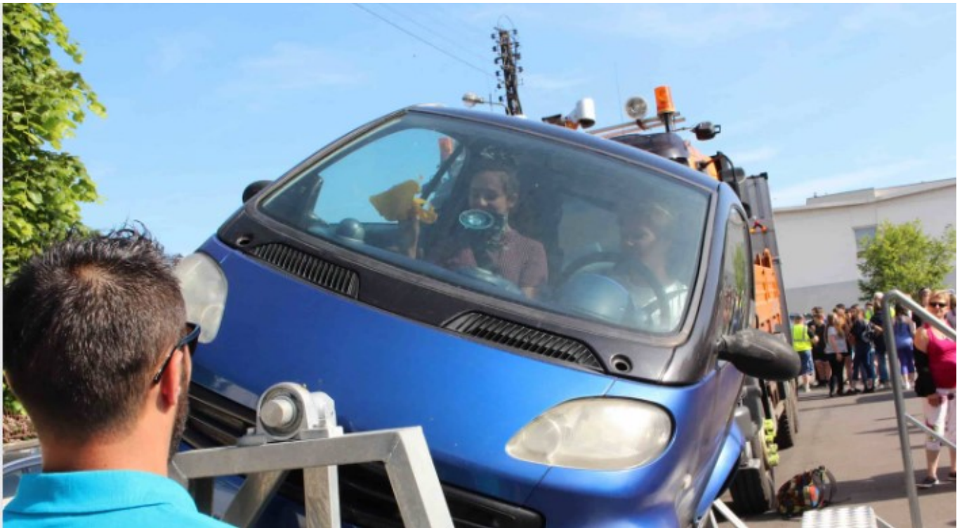
La voiture tonneau