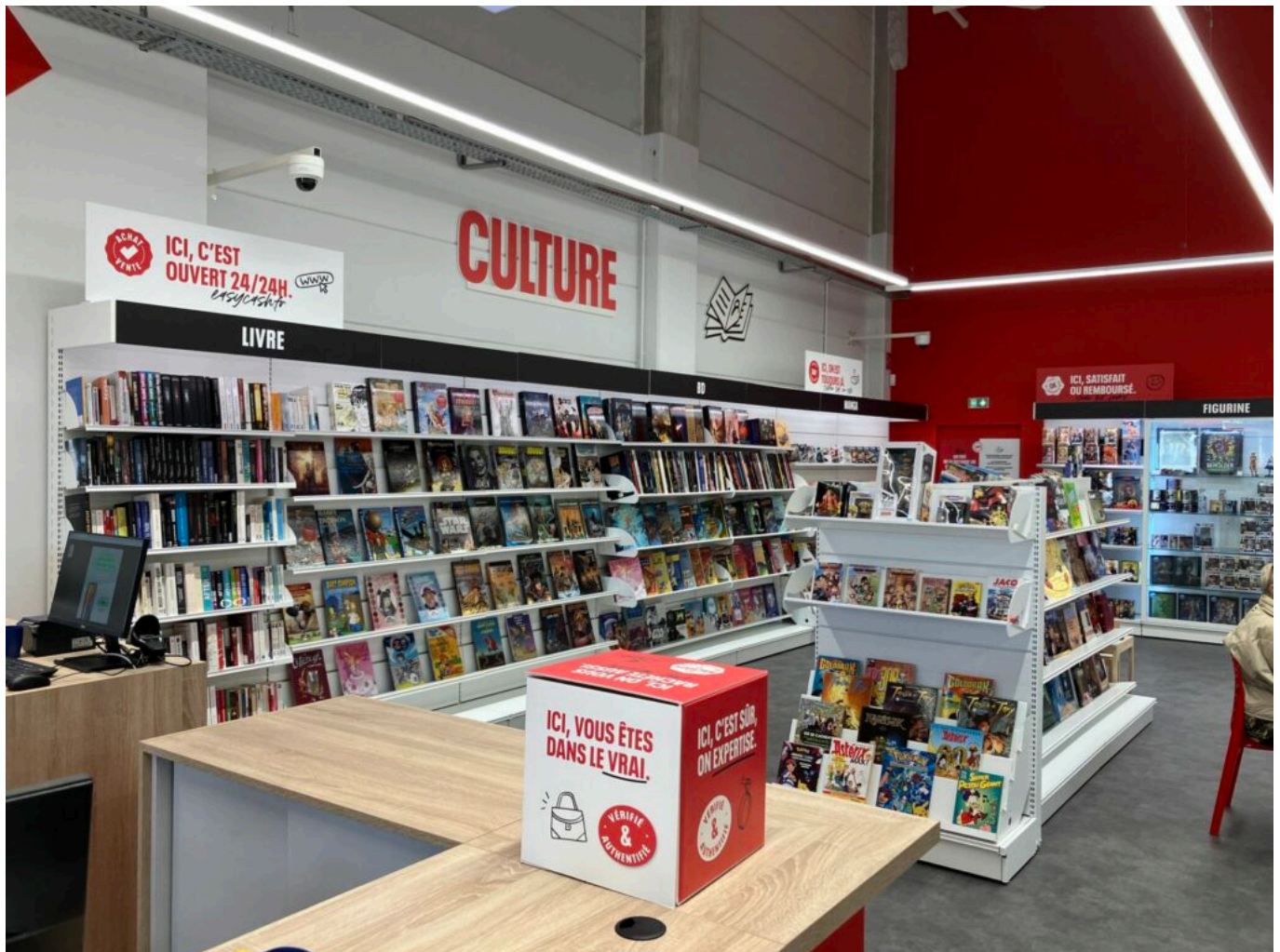
Le magasin d'Avignon.

« La seconde main fait partie des marchés les plus porteurs actuellement, nous sommes convaincus d'être au bon endroit au bon moment et que le concept Easy Cash répond plus que jamais aux attentes des Français, expliquent les deux franchisés. Il véhicule des valeurs en phase avec les nôtres : un mode de consommation responsable et vertueux et le goût de la rencontre et de la proximité. »