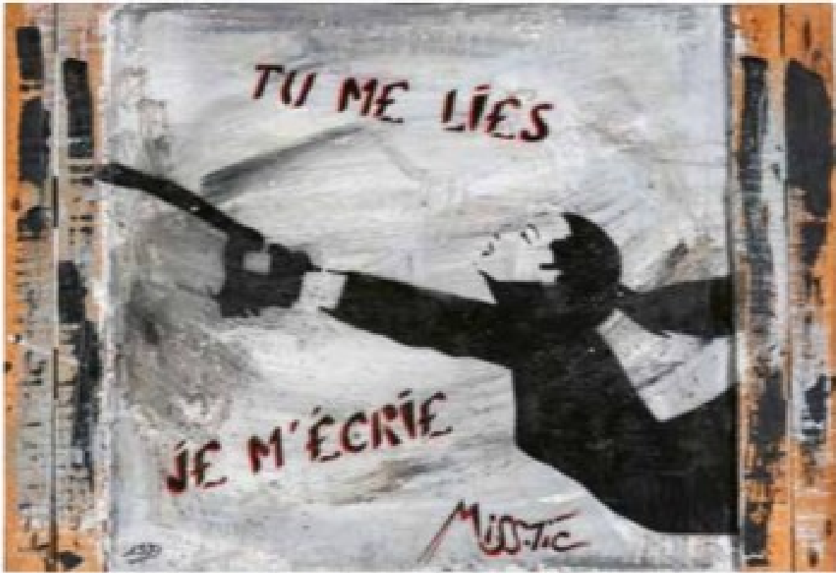
MISSTIC (1956-2022) : Tu me lis, je m'écris. Pochoir sur toile et bois. Signé en bas et daté 1990. Dimensions: 72x103 cm. 2 000/3 000 €

Nous avons aussi repéré cet important bureau en placage de noyer à caisson central suspendu également doté de deux grand tiroirs, le tout en piètement de fonte d'aluminium. Le plateau est ouvrant en son centre, découvrant le caisson dossiers. Il s'agit d'une édition ancienne. Ce mobilier est signé George Nelson (1908-1986) designer et Herman Miller fabricant mobilier international éditeur 64906. Ce bureau pourrait être accompagné du fauteuil à haut dossier pivotant sur roulettes avec sa paire de chaises pivotantes signées Charles et Ray Eames, éditions anciennes le tout à partir de 1 500€.