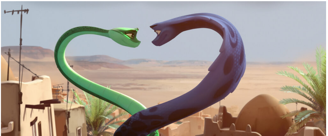
Le long métrage d'animation Sahara est sorti en 2017.

Comme pour Sahara , un film animé produit et travaillé par la Station animation qui a rencontré un succès important avec plus d'un million d'entrées en 2017, le studio est aussi producteur sur le film de Reem Kherici. Michel Cortey et l'ensemble de la direction du studio seront donc particulièrement attentifs au succès de cette nouvelle sortie.