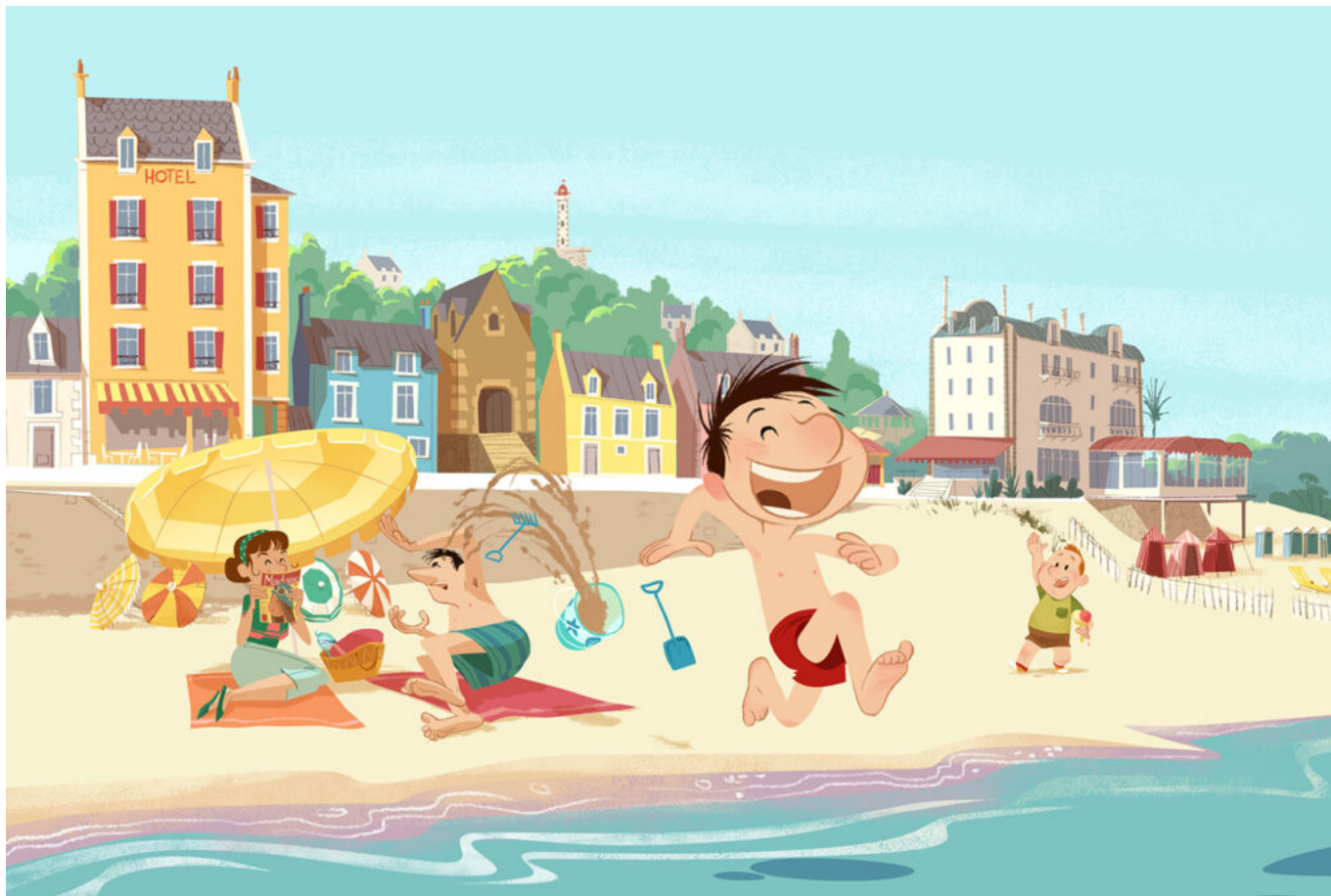
Le Petit Nicolas

« Nous avons l'espoir que l'humain reste prépondérant à nos métiers ».