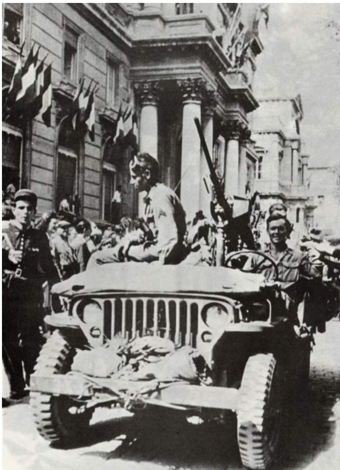
La ville d'Avignon sera libérée le 25 août par les troupes franco-américaines, ici devant la mairie de la cité des papes.