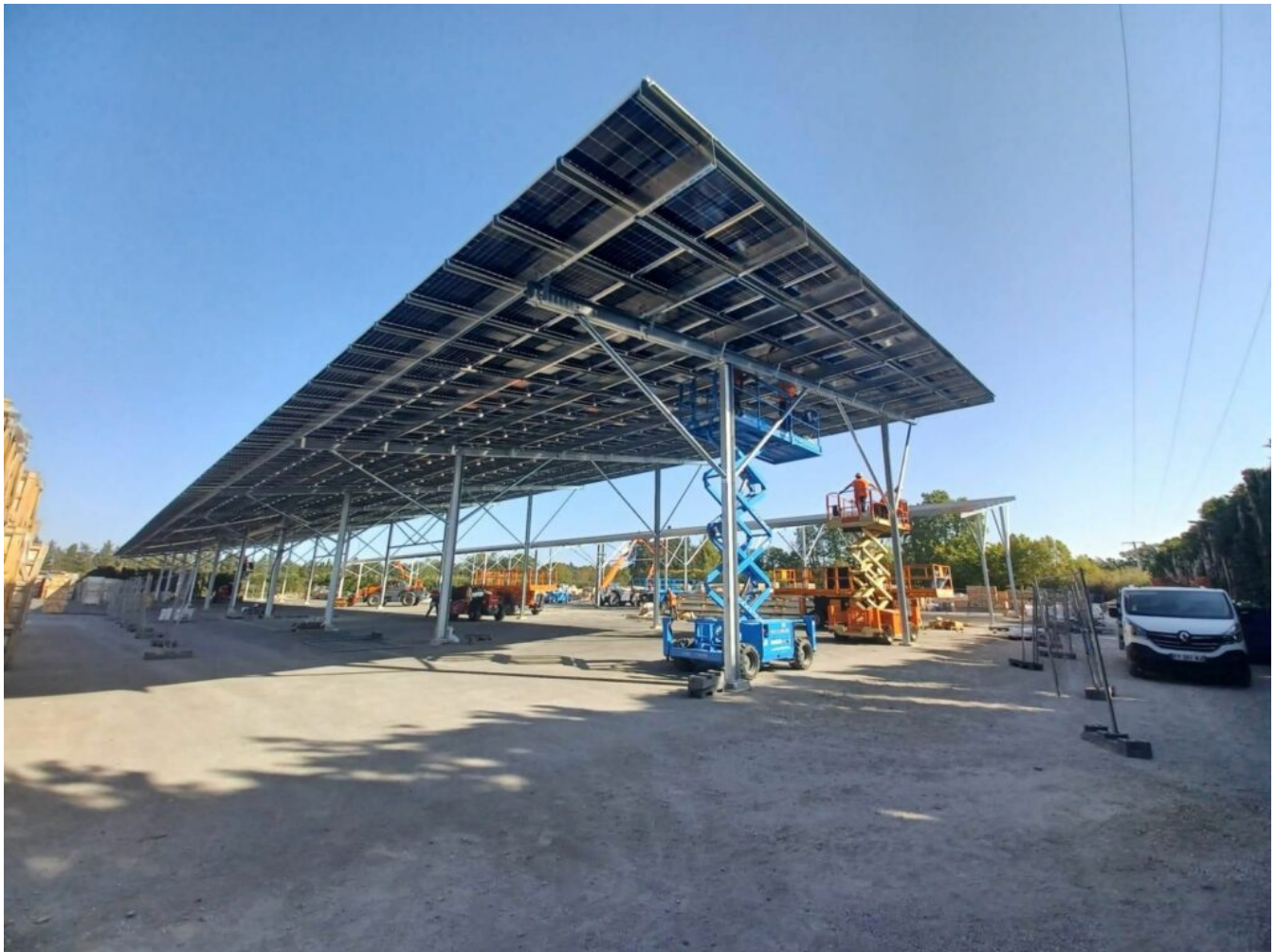
Chantier sur les zones de stockage de Natural Rock Distribution à Avignon.

Les développeurs territoriaux de Melvan essayent de déterminer les meilleurs endroits pour implanter les projets, tout en prenant en compte les nombreuses contraintes environnementales, topographiques, paysagères, sociales ou sociétales, mais aussi les contraintes de raccordement, de gisement, d'accès et d'urbanisme.