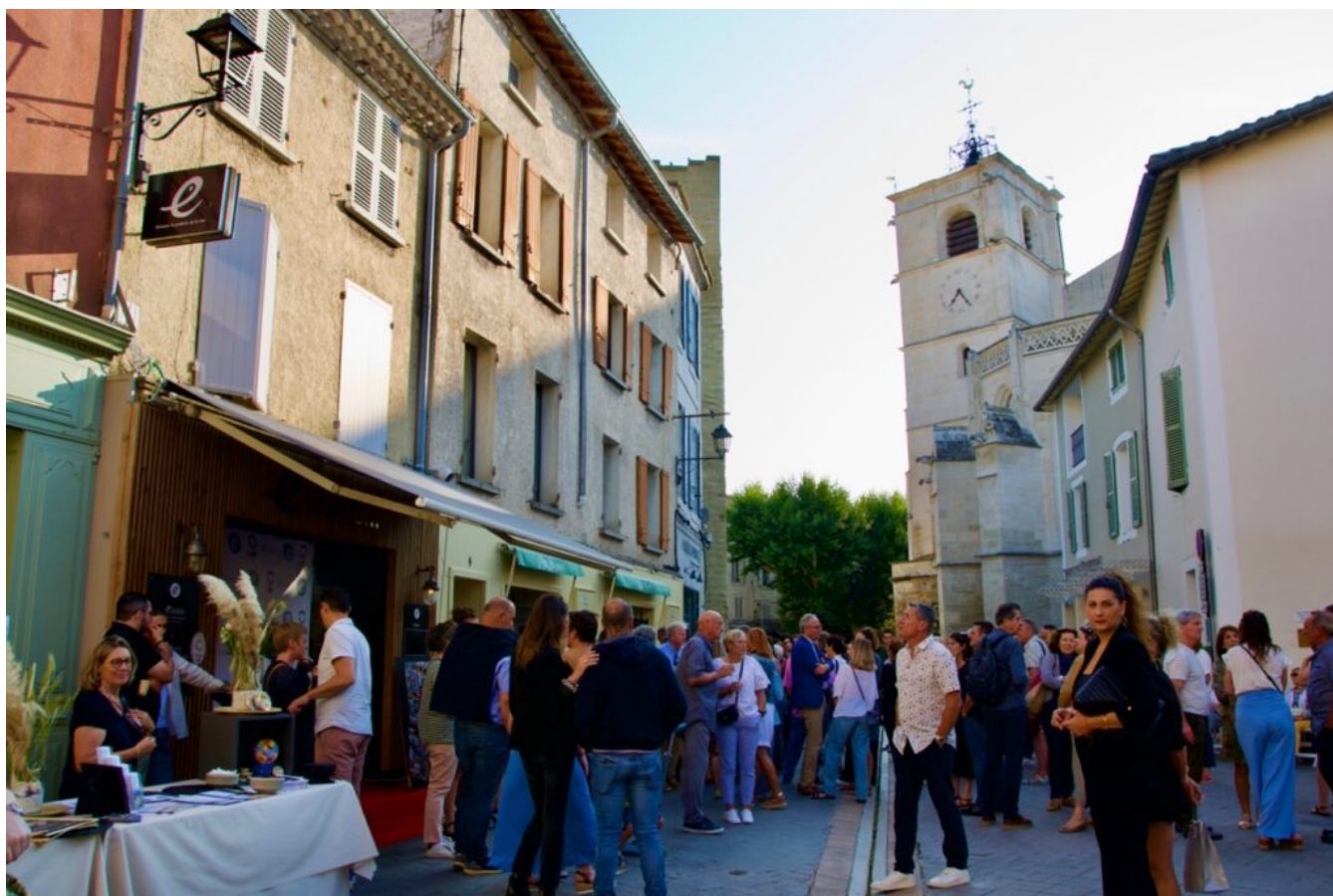
La place Ferdinand Buisson, à l'Isle-sur-la-Sorgue, lors de l'anniversaire de la Poissonnerie Eulalie.