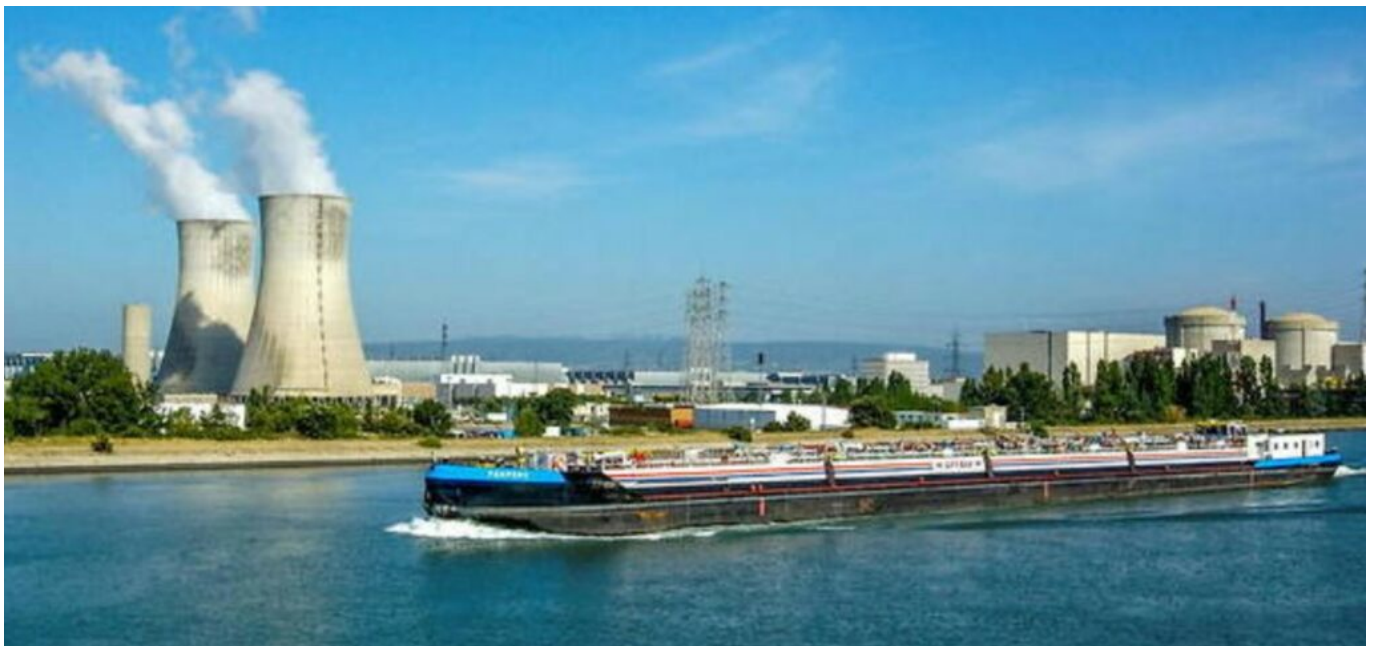
Centrale de Tricastin, image d'archive

Si l'agriculture est la première activité consommatrice d'eau à hauteur de 58% devant l'eau potable qui, elle, intervient à 26%, le refroidissement des réacteurs des centrales nucléaires électriques monte sur la 3 e place du podium avec 12% de consommation d'eau, de la consommation totale française, d'après le service des données et études statistiques du Ministère de la Transition écologique.