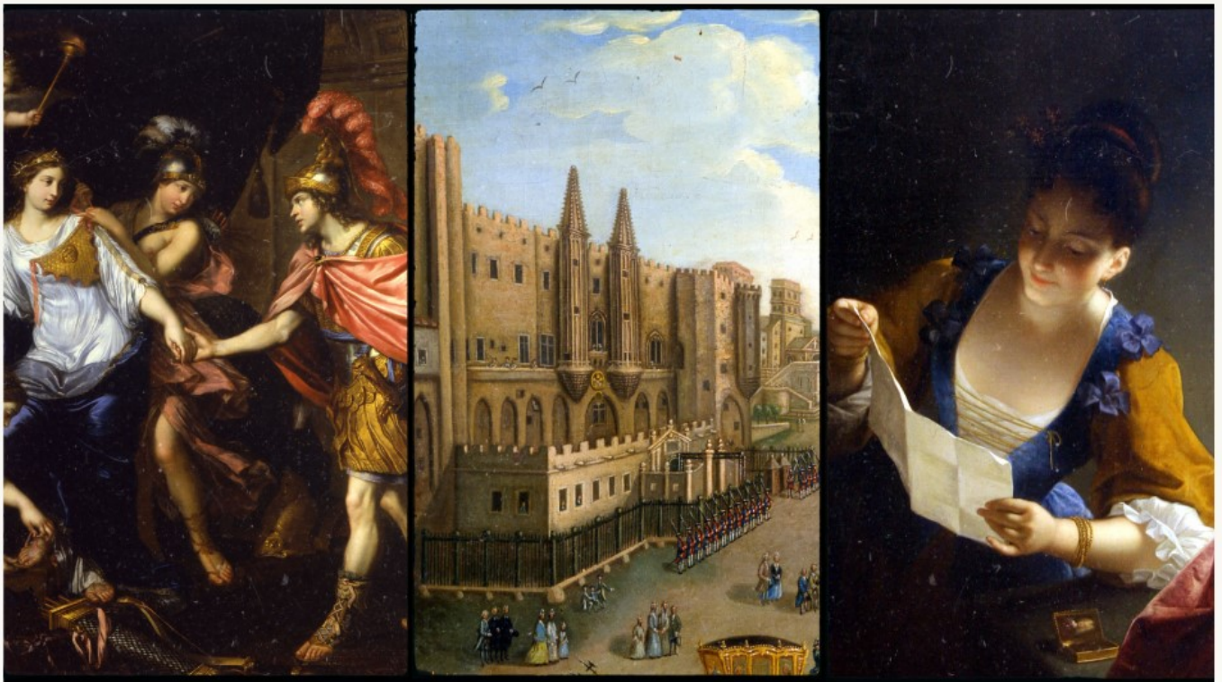
MIGNARD P- La rencontre d'Alexandre avec la reine des Amazones