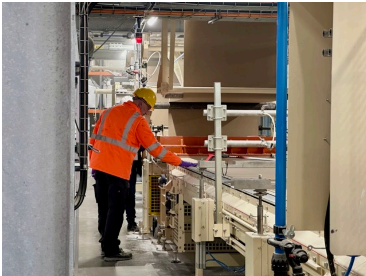
La ligne pilote de Carpentras.