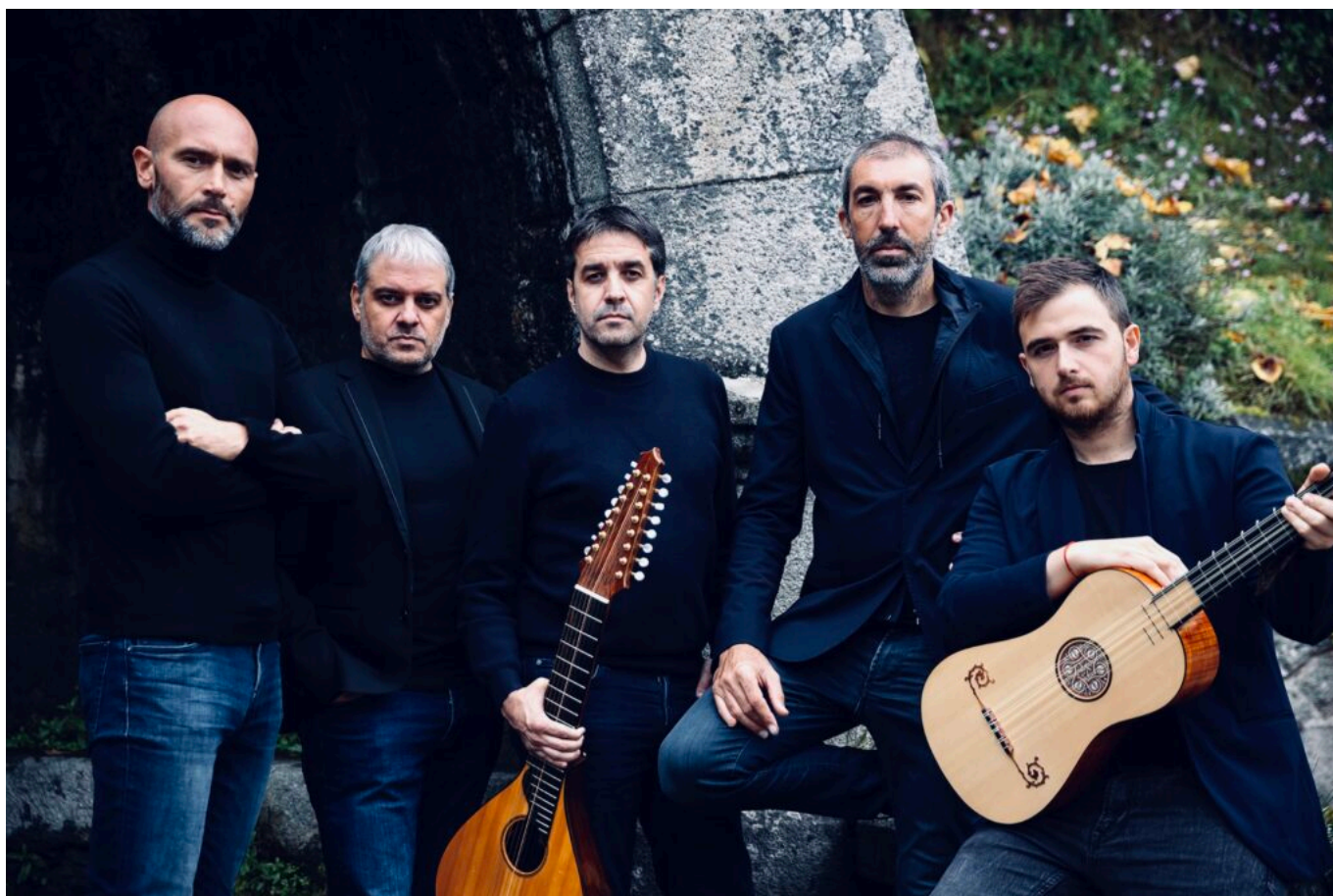
I Messageri Cipyright Frères Andreani