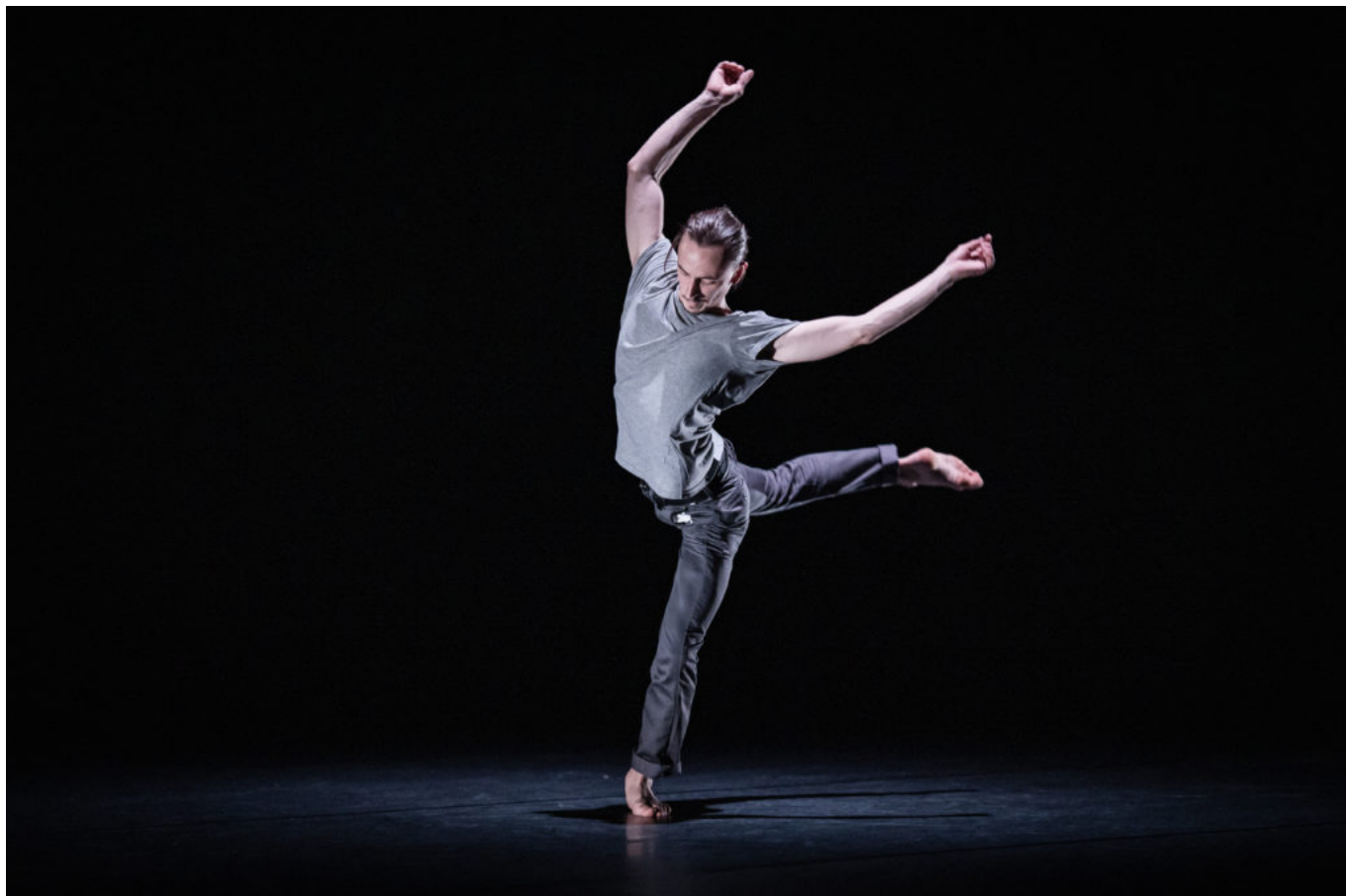
Emprise