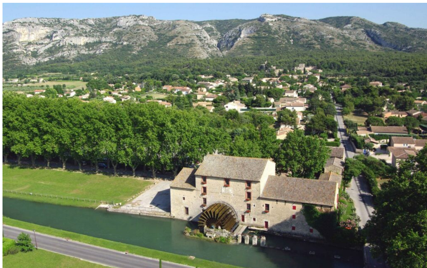
Le siège de l'Arbre vert aux Taillades. L'entreprise n'a jamais aussi porté son nom.

1 Français sur 4 utilise l'Arbre vert pour la maison, quel que soit le produit. Le nouveau gel lave-vaisselle « tout en 1 » sans phosphates ni phosphonates, des adoucissants, des détachants, des sprays, mais aussi des produits d'entretien d'antan, ceux qu'utilisaient nos grands-mères qui étaient naturels comme le savon noir, le savon de Marseille, le bicarbonate de soude ou le vinaigre blanc ménager 14° qui détartre.