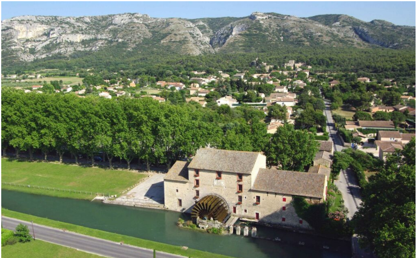
Le siège de l'Arbre vert aux Taillades. L'entreprise n'a jamais aussi porté son nom.

1 Français sur 4 utilise l'Arbre vert pour la maison, quel que soit le produit. Le nouveau gel lave-vaisselle « tout en 1 » sans phosphates ni phosphonates, des adoucissants, des détachants, des sprays, mais aussi des produits d'entretien d'antan, ceux qu'utilisaient nos grands-mères qui étaient naturels comme le savon noir, le savon de Marseille, le bicarbonate de soude ou le vinaigre blanc ménager 14° qui détartre.