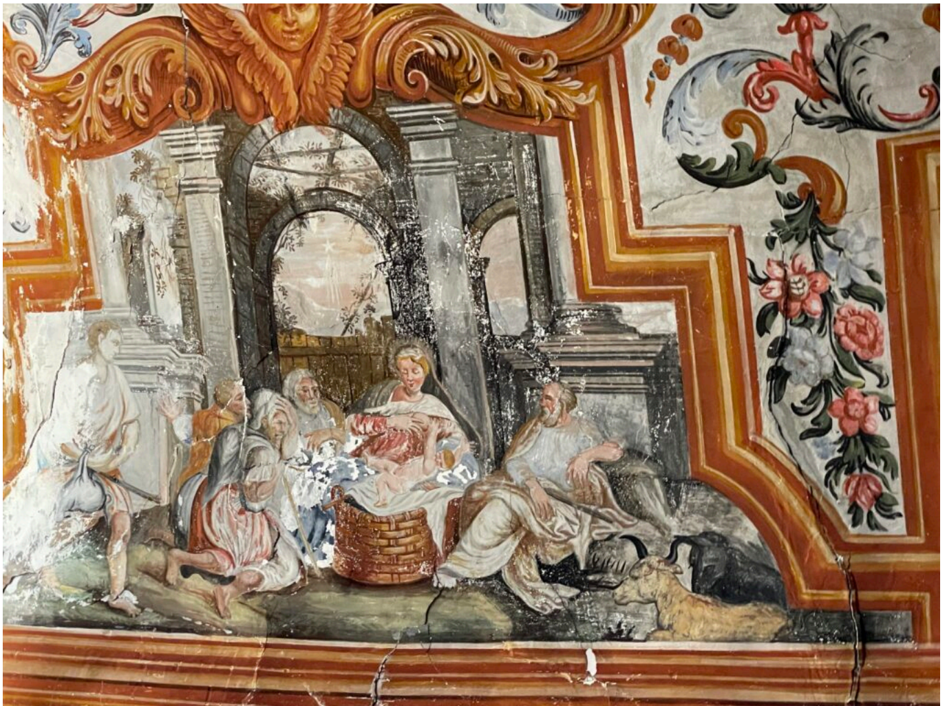
Détail d'une fresque de la chapelle Notre dame la Brune