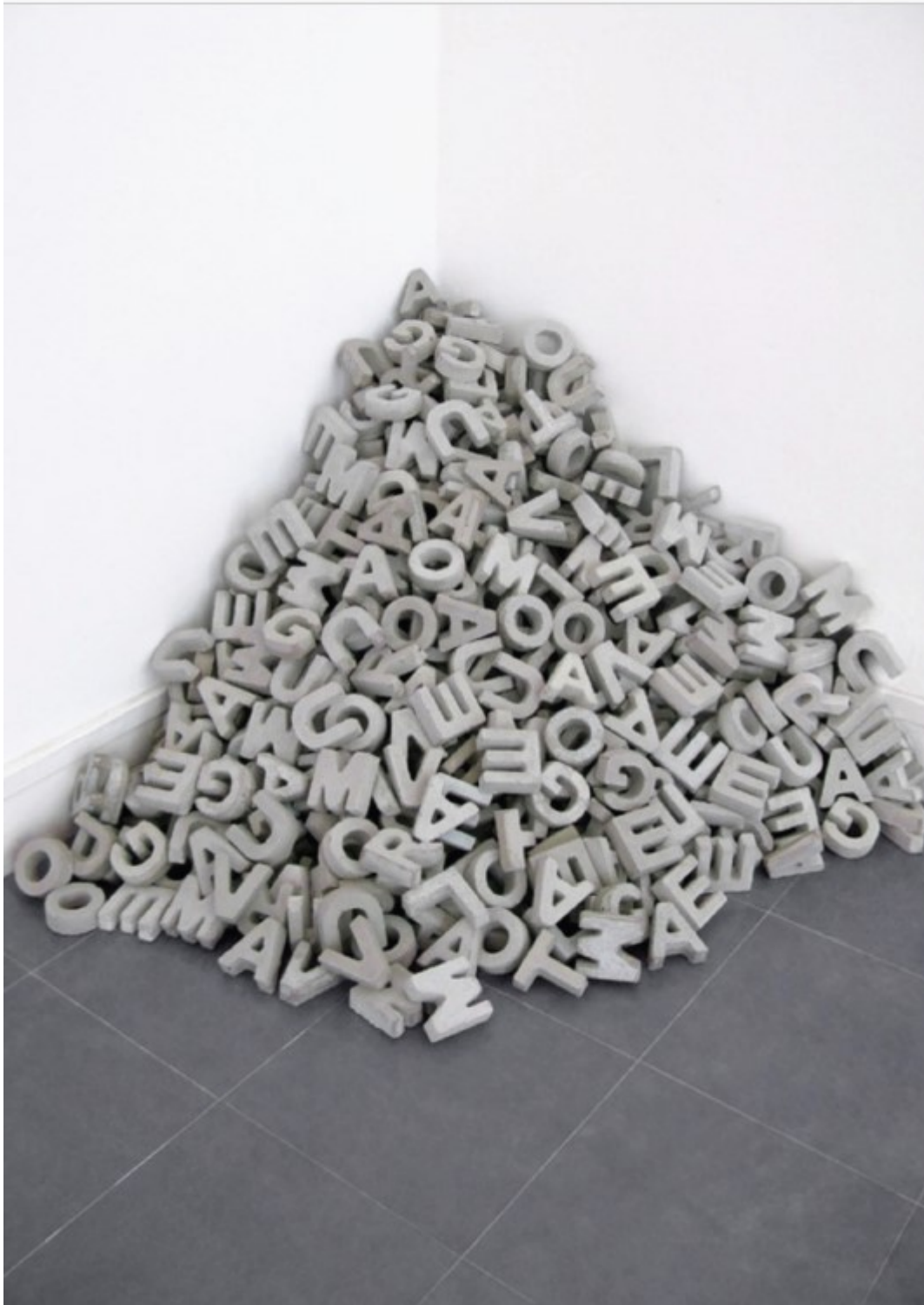
Les lettres en béton, installation, Copyright Marie Jeanselme