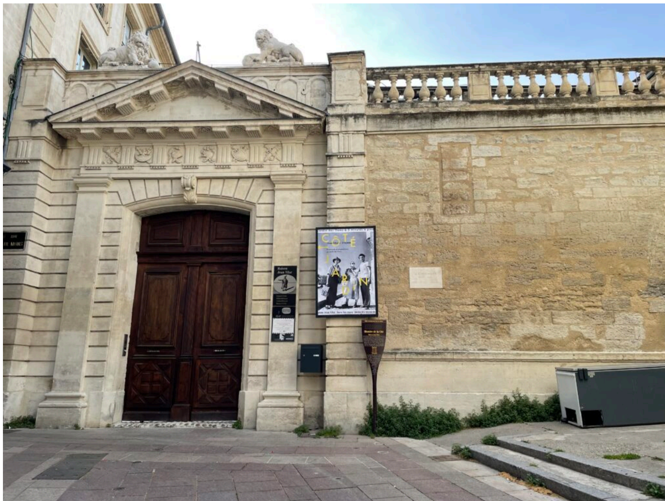
La Maison Jean Vilar réouvre au public

du 1er août 2022 au 30 avril 2023 : Du mardi au samedi de 14h à 18h. Entrée : Le billet d'entrée de l'exposition Infiniment - Maria Casarès, Gérard Philipe - une évocation donne l'accès à toutes les expositions de la Maison Jean Vilar. À partir du 7 juillet 2022 : L'œil présent - Photographier le Festival d'Avignon au risque de l'instant suspendu. Tous les soirs - Jean Vilar, Notes de service, TNP 1951 - 1963 Plein tarif : 6€ Tarif réduit : 3€ Entrée gratuite pour les moins de 12 ans. Tout le programme de l'été ici . Maison Jean Vilar. Place de l'Horloge, Montée Paul Puaux. 8, rue Mons à Avignon. 04 90 86 59 64.