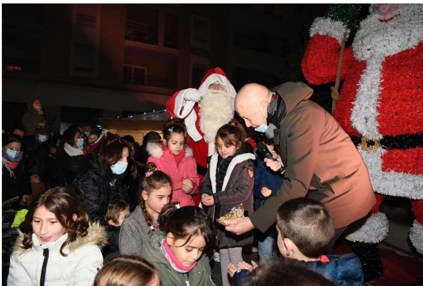
Noël 2021.

Place cette année à un véritable village de Noël. Il est composé de 9 grands décors lumineux, comprenant ours géants, traîneau avec des rennes et un père Noël géant de 4m de haut. Ce village est entouré d'une forêt de sapins de 2 à 5 m de haut, eux aussi illuminés. Une boîte aux lettres est également là pour recueillir le courrier des enfants. Les décorations s'inspirent de la Scandinavie, de ses forêts et de ses nuances de bois.