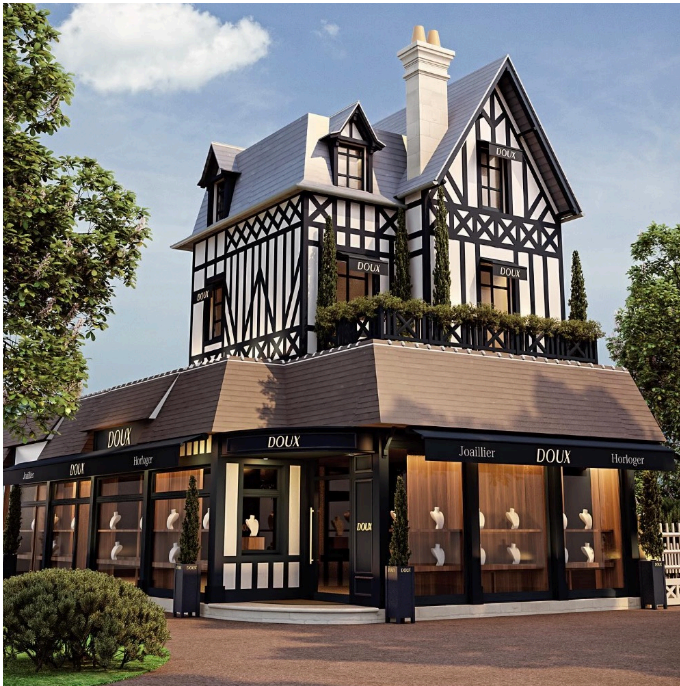
La future boutique Doux à Deauville