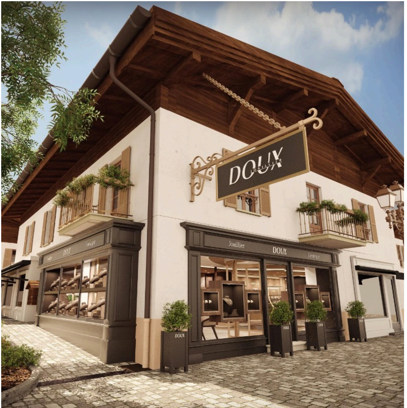
La future boutique Doux à Mégève