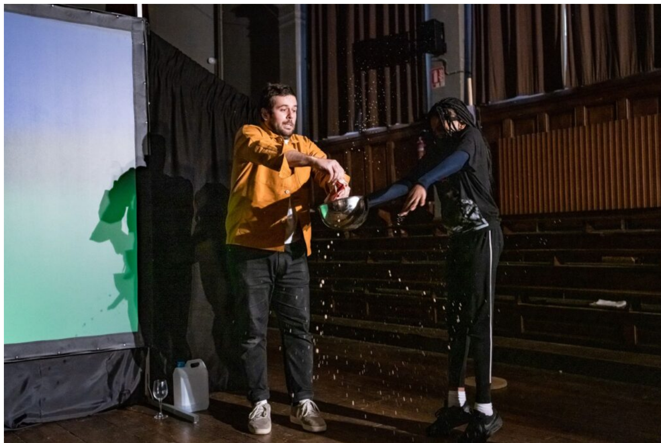
Doublon © Julien Helaine

L'événement rassemble tous les spectres de la magie nouvelle : mentalisme (avec le spectacle Doublon de Marc Rigaud), manipulation d'objets ou de cartes (avec Je suis 52 de Claire Chastel), ombromagie (dans le cadre de la Magic Night avec Philippe Beau - ombromane), arts de l'illusion et arts numériques (avec le cabaret d'hologrammes de la Compagnie 14:20).