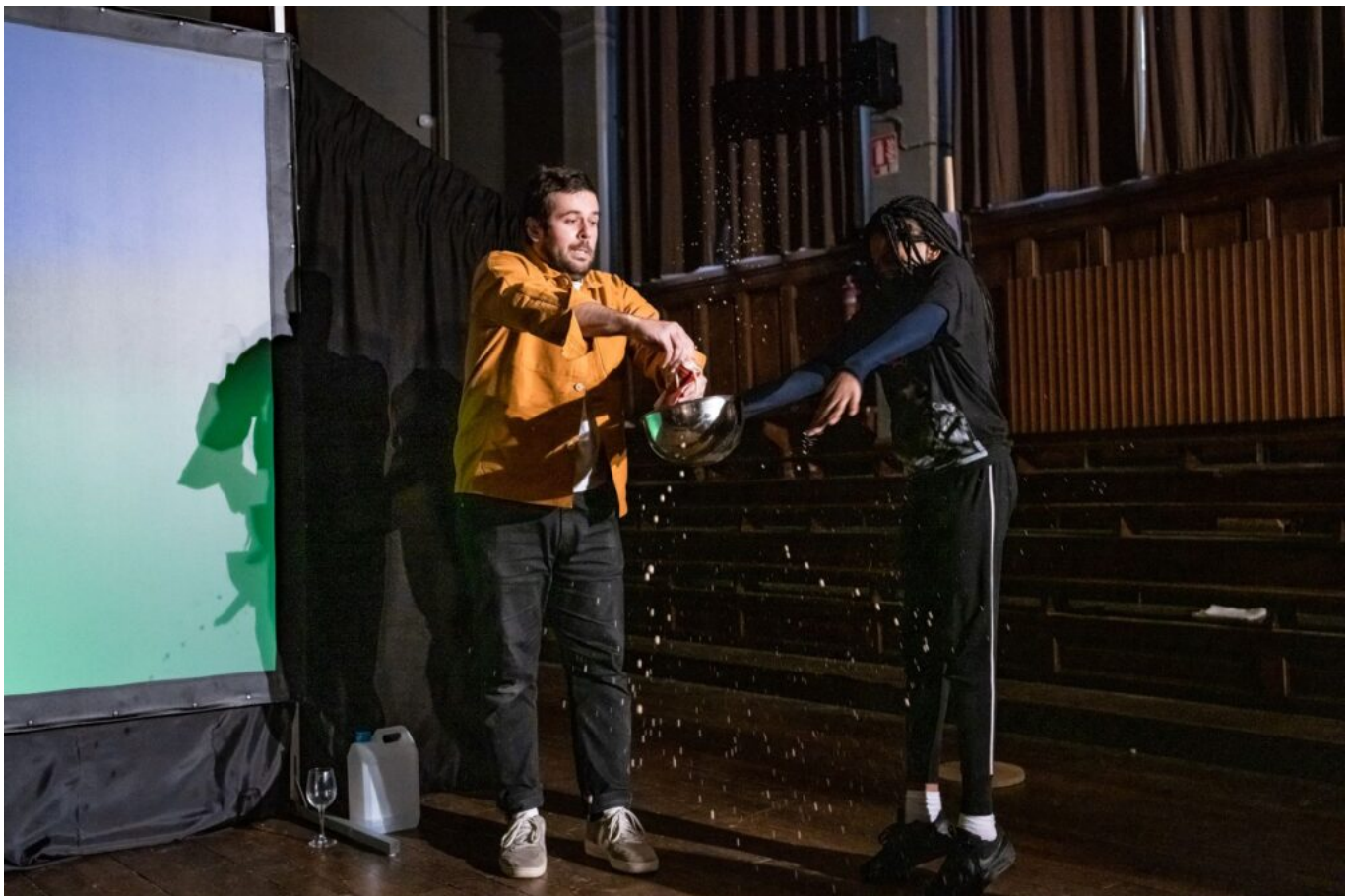
Doublon © Julien Helaine

L'événement rassemble tous les spectres de la magie nouvelle : mentalisme (avec le spectacle Doublon de Marc Rigaud), manipulation d'objets ou de cartes (avec Je suis 52 de Claire Chastel), ombromagie (dans le cadre de la Magic Night avec Philippe Beau - ombromane), arts de l'illusion et arts numériques (avec le cabaret d'hologrammes de la Compagnie 14:20).