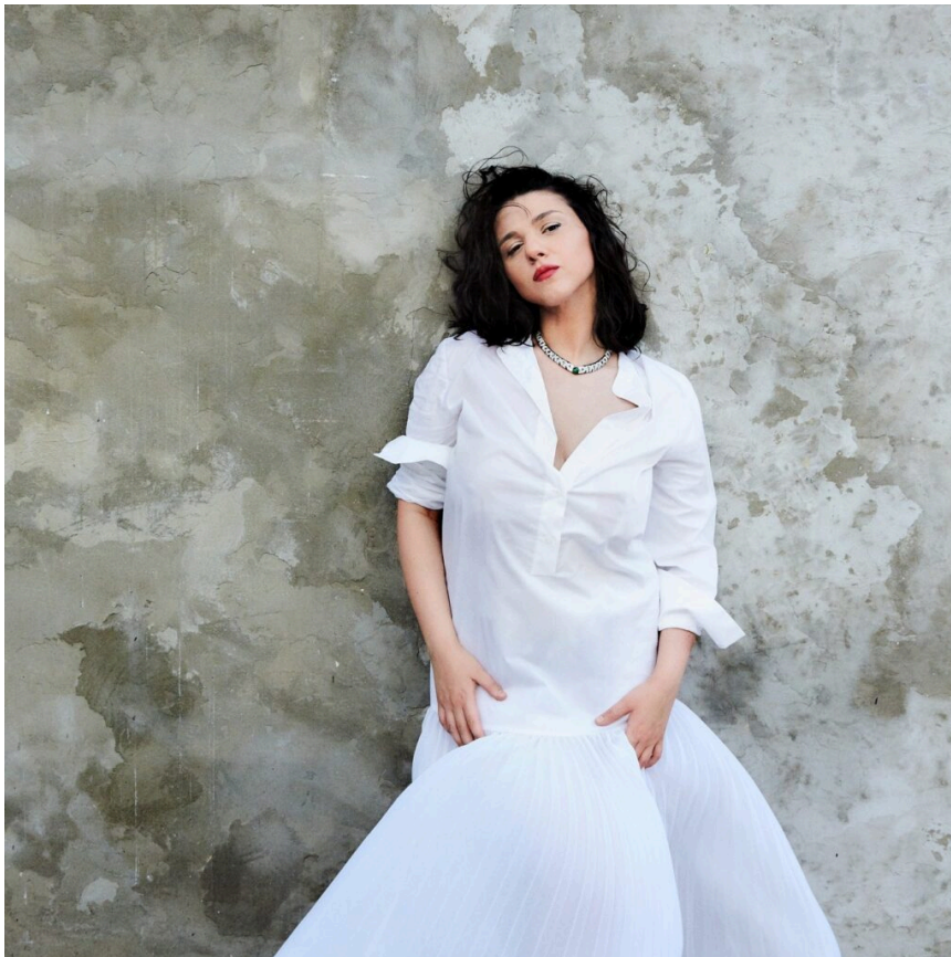
Khatia Buniatishvili.

du piano, Khatia Buniatishvili qui a donné son 1er concert à l'âge de 6 ans. Elle a remporté le Grand Prix Horowitz à Kiev en 2033 puis le Prix du Public au Concours Arthur Rubinstein en 2008. Depuis, elle parcourt la planète pour une carrière internationale et elle viendra pour la 1ère fois aux Chorégies interpréter l'émouvant Concerto pour piano n° 23 de Mozart.