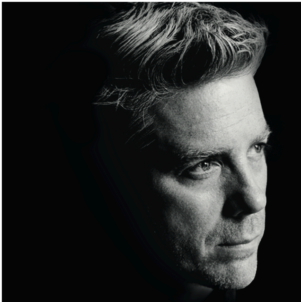
Kyle Eastwood.