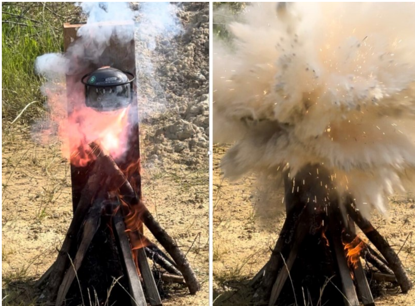
Le Block'Fire en situation réelle.