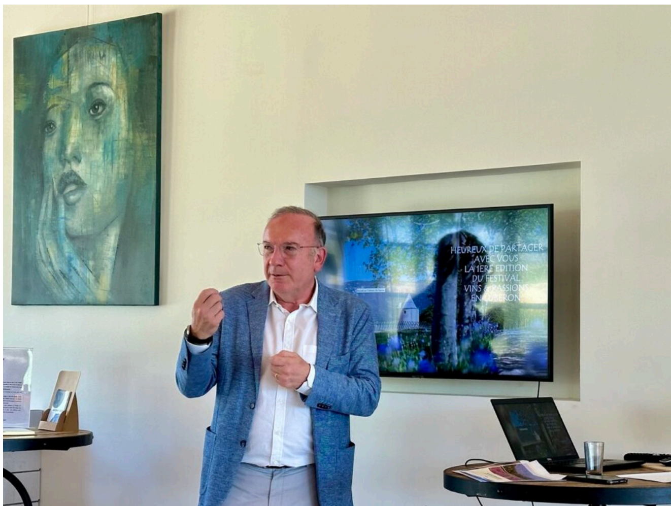
Pierre Gattaz lors de la présentation de l'événement aux vignerons, producteurs et experts participants, aux partenaires et à la presse.