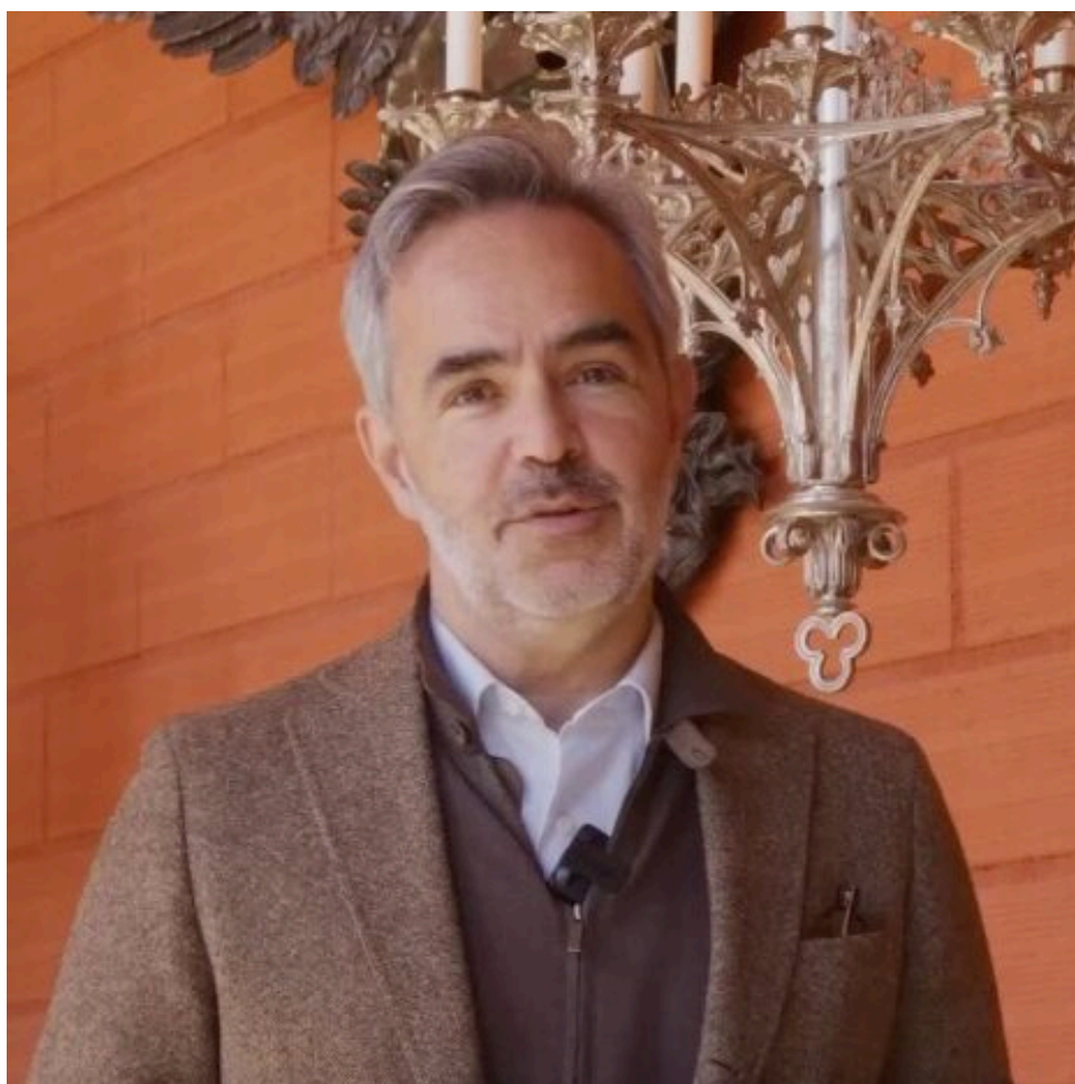
Régis Mathieu

Le monde entier se souvient avec émotion de ce 15 avril 2019, quand, la charpente de chênes multiséculaires de la cathédrale s'est embrasée dans un immense et effrayant panache de fumée noire, quand la flèche conçue par Eugène Viollet-le-Duc en 1859 s'est brisée et quand la voûte s'est écroulée.