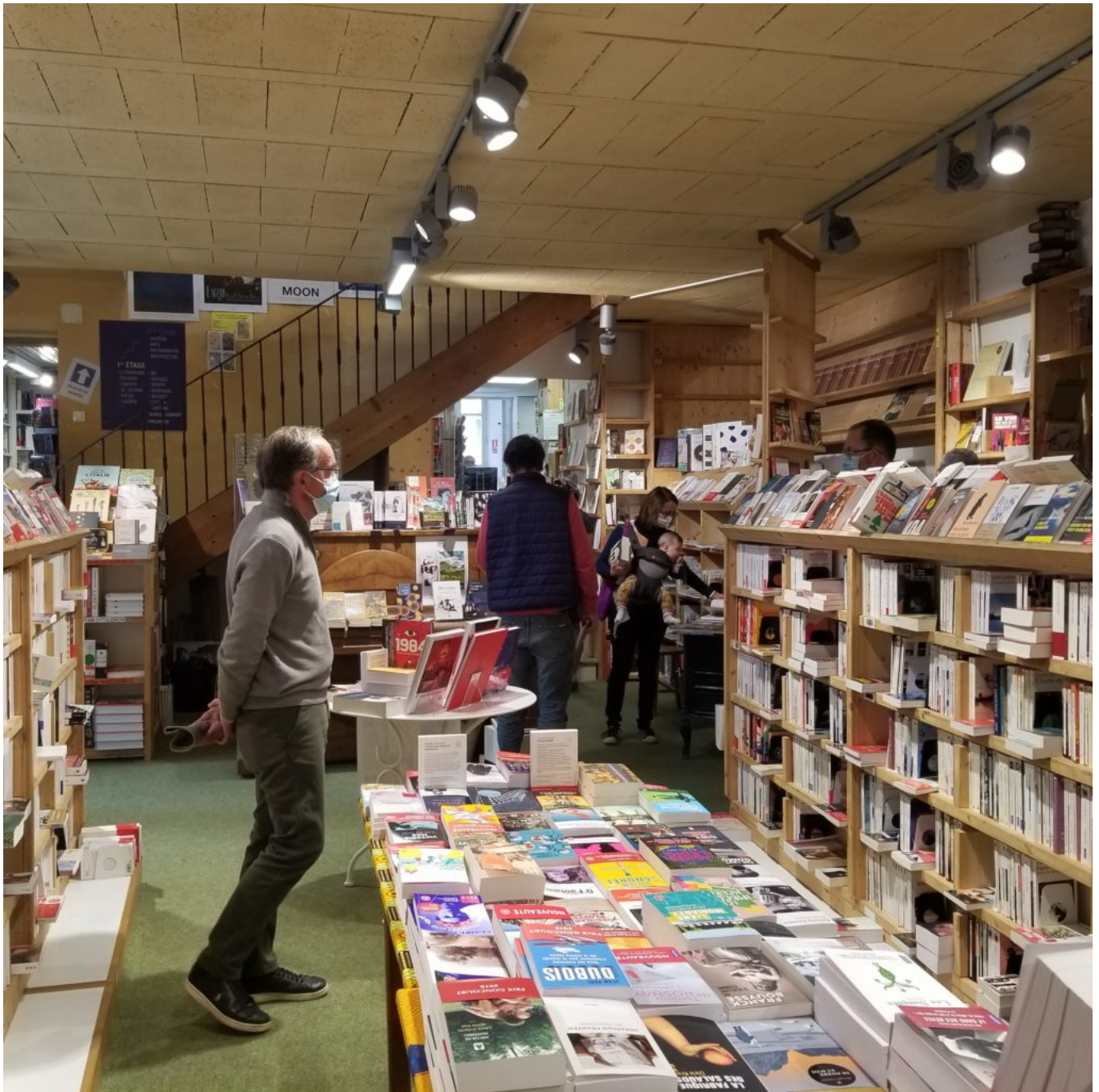
La librairie Le bleu réunit toutes les générations