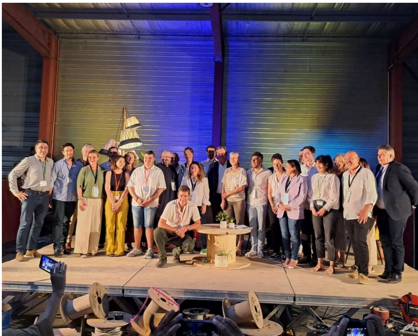
Les intervenants et animateurs de la soirée.