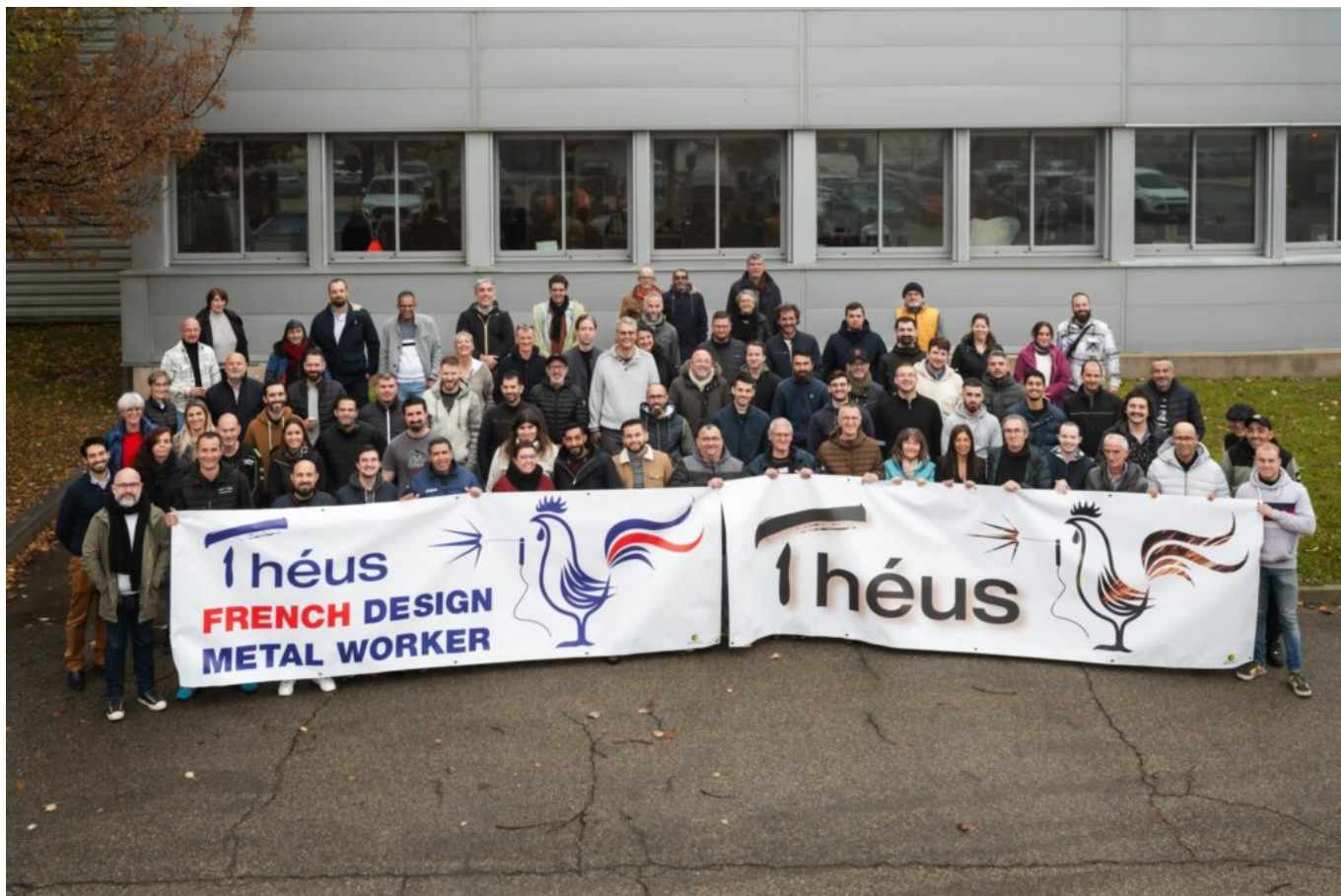
L'équipe de Theus Industrie