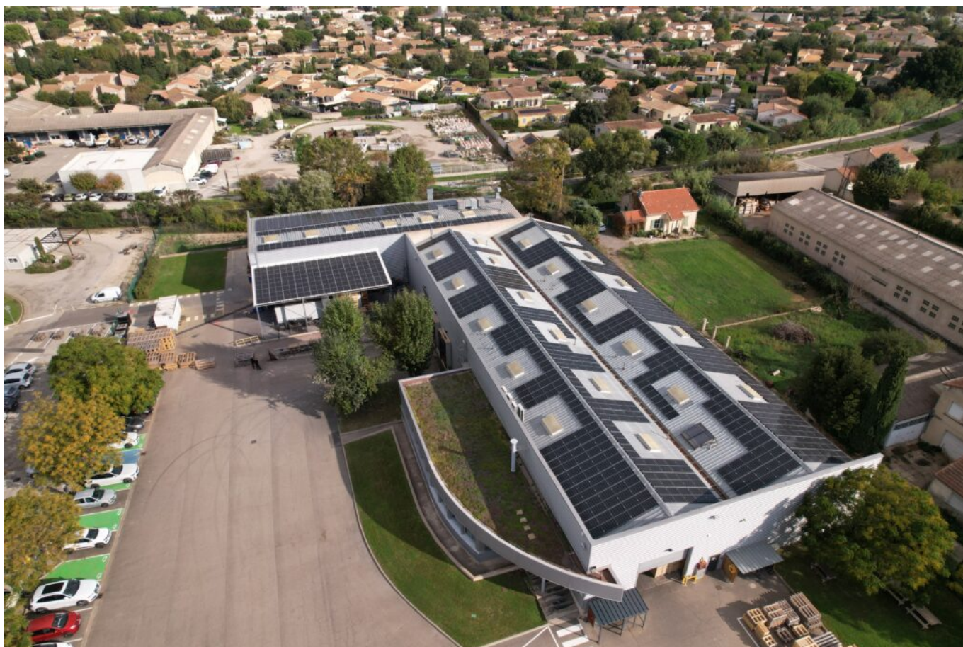
Le site de Cavaillon

Avec 700 panneaux sur une surface de 2 400 M 2 l'entreprise couvre aujourd'hui en moyenne annuelle 64 % de ses besoins. Une belle performance. L'investissement de 400 K€ sera remboursé en moins de 5 ans. Il a été financé pour part essentielle par un emprunt bancaire avec l'apport d'une subvention de 51 932 € de la région PACA dans le cadre du programme Solaire Ready. Cet apport a permis le financement des travaux de consolidation de la toiture du bâtiment d'accueil des panneaux. « Notre banque nous a suivi assez facilement car l'investissement est immédiatement rentable » complète Sophie Kirnidis.