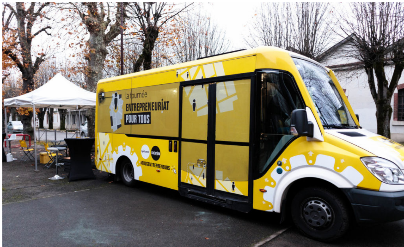
Le bus de l'entrepreneuriat.

A noter que LMV fait aussi partie des recruteurs puisque plusieurs postes sont à pourvoir dans le Pôle petite enfance, notamment avec l'ouverture en janvier prochain d'un nouvel établissement d'accueil du jeune enfant (EAJE) à Cavaillon. Le service de l'urbanisme aussi recherche des instructeurs du droit des sols. Le service collecte recherche également régulièrement des agents pour des missions de remplacement.