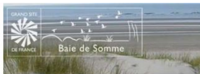
variante blanc sur fond transparent