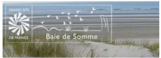
variante blanc sur fond transparent