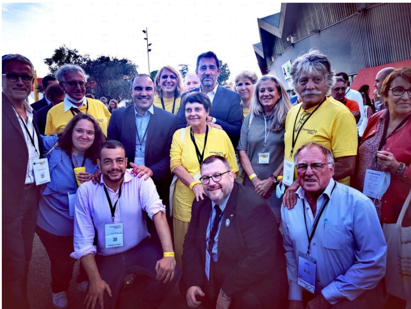
Christophe Castaner au coté des militants LREM Vaucluse