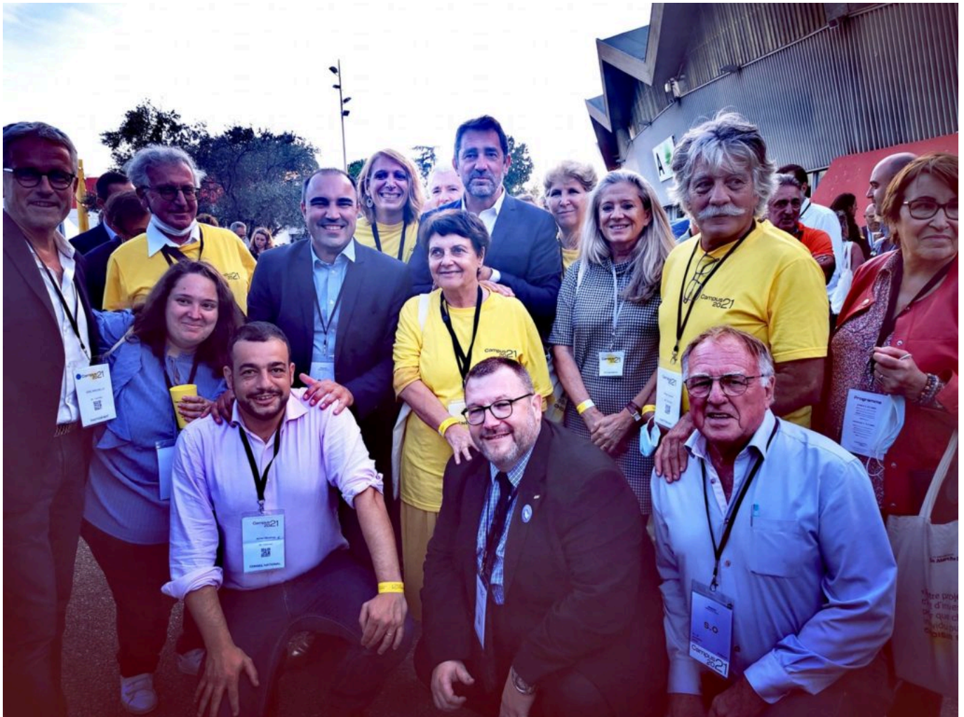
Christophe Castaner au coté des militants LREM Vaucluse