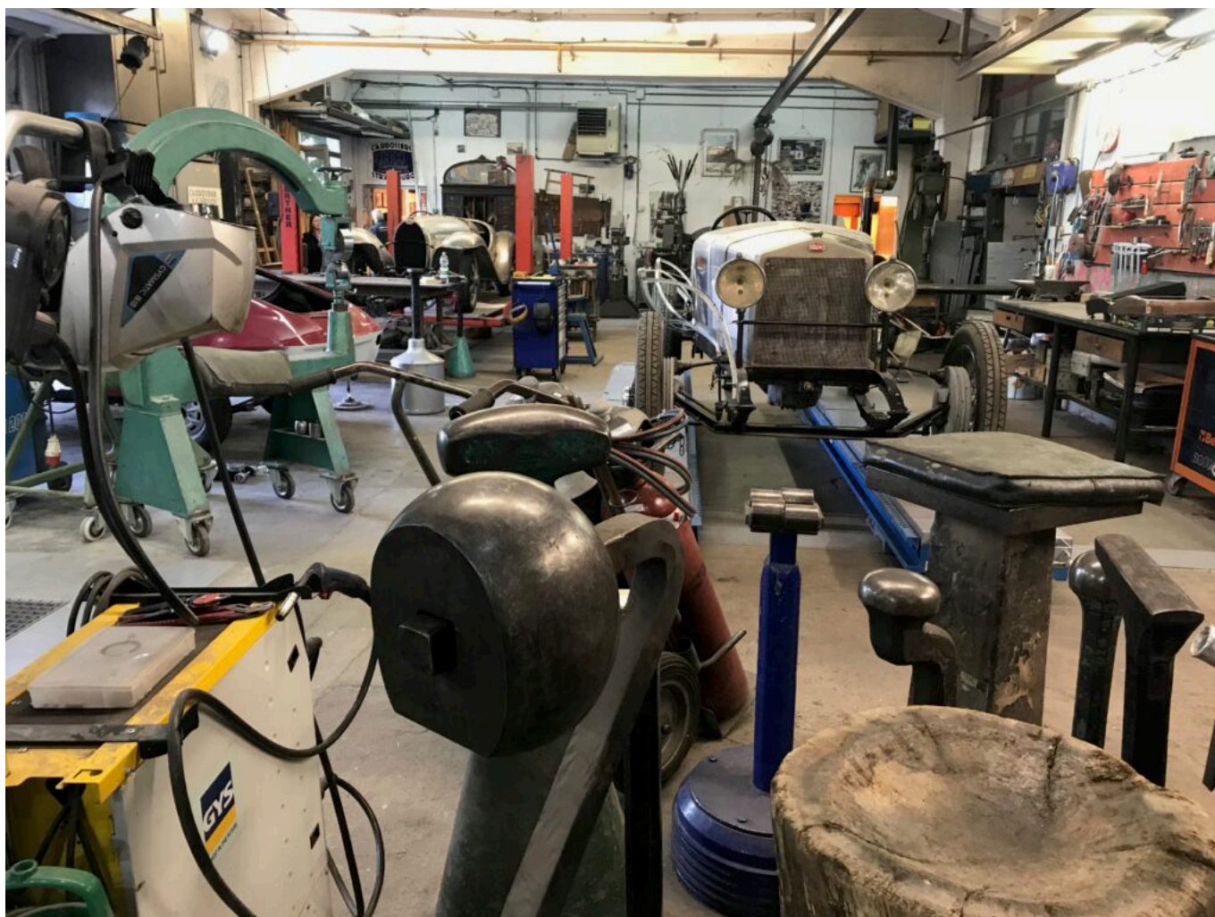
un atelier de restauration