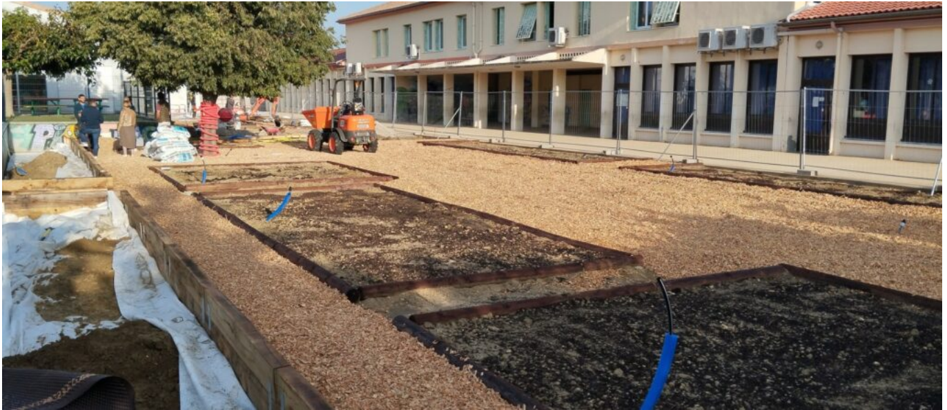
Le chantier de désimperméabilisation de l'école.

Louis Driey est intarissable sur les chantiers qu'il a initiés pour améliorer la qualité de vie de ses concitoyens tout en minimisant les factures. « L'éclairage public se fait avec des LED, ça représente quand même 1 200 lampadaires. »