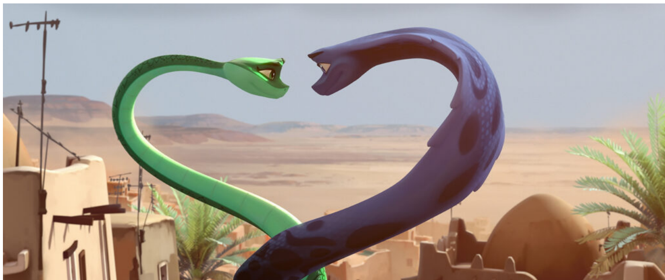
Le long métrage d'animation Sahara est sorti en 2017.