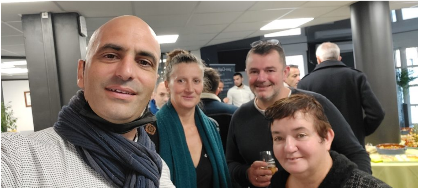
Une inauguration sous le signe de la convivialité.