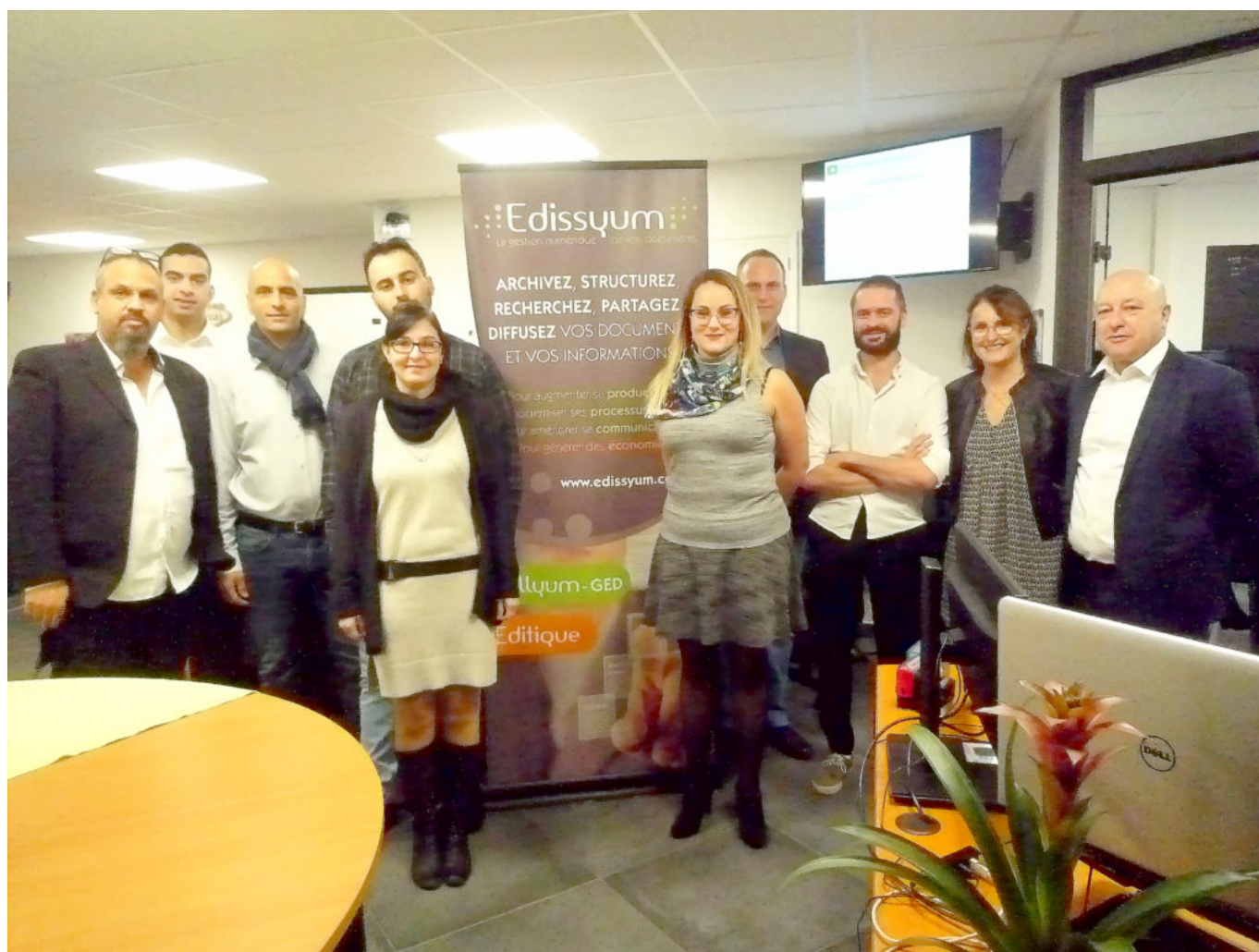
Les collaborateurs ont déjà pris leurs quartiers.

Plus d'informations, cliquez ici . Retour en images de l'inauguration :