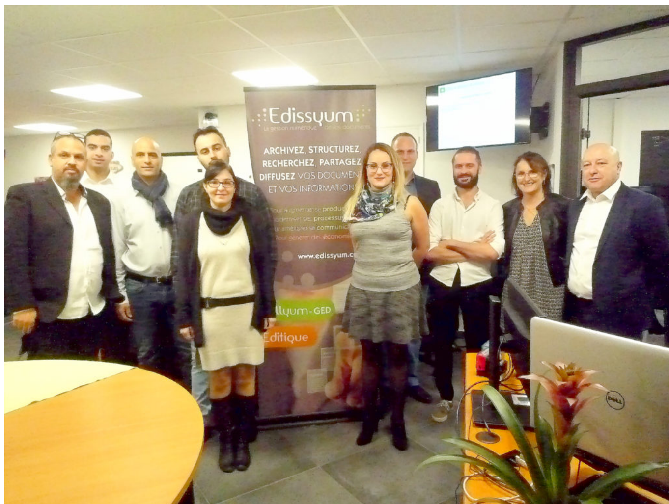
Les collaborateurs ont déjà pris leurs quartiers.

Plus d'informations, cliquez ici . Retour en images de l'inauguration :