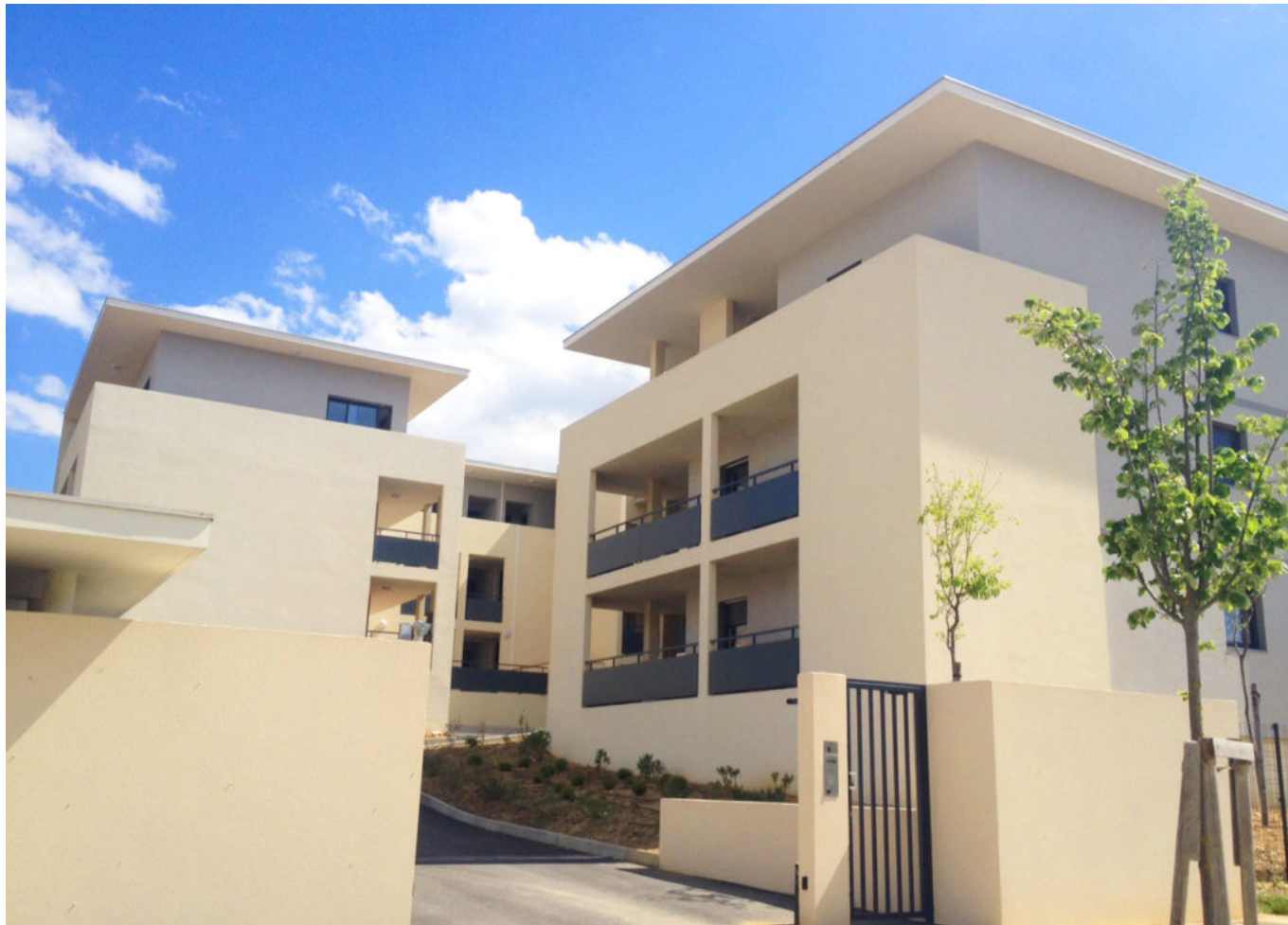
Les Dentelles de Mistral habitat (aujourd'hui devenu Vallis habitat) à Bédarrides en 2016 (archives).