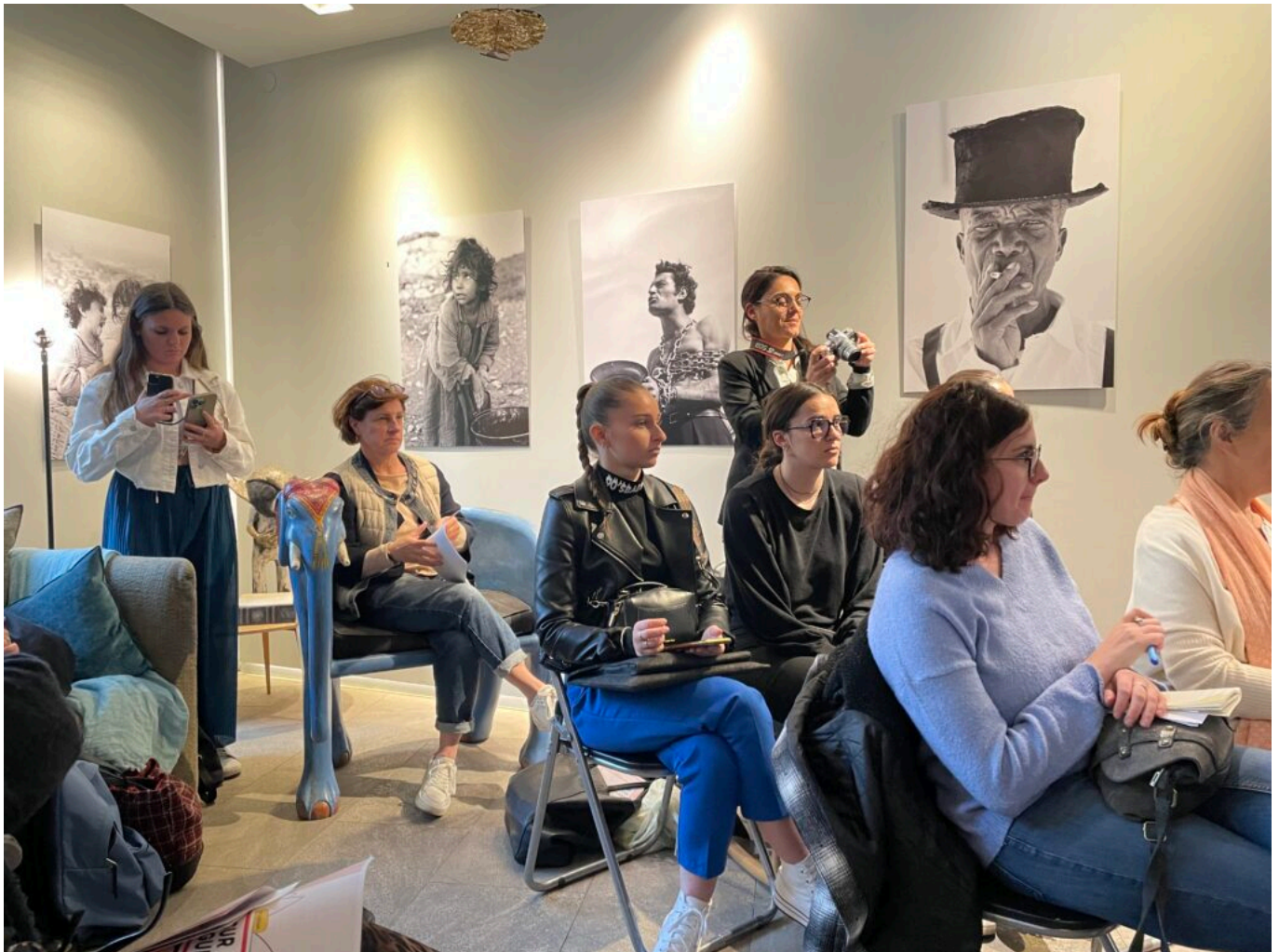
Au mur, les œuvres de l'immense photographe Hans Silvester

vont dérouler la belle initiative de Lire sur la Sorgue qui réunit toute l'année les personnes les plus éloignées de la lecture, tous ceux qui aiment lire, ouvrir des bandes dessinées, jusqu'au cœur des entreprises où l'on fait alliance grâce à ces pages que l'on tourne ensemble. Bref, on y œuvre à ce qu'il y a de plus compliqué et de plus beau : faire société.